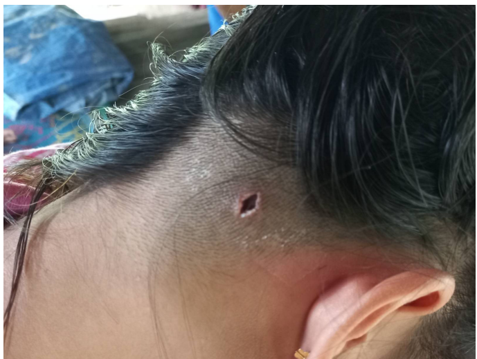
တၢ်ဂီၤတဘျီအံၤ ဘၣ်တၢ်ဟံၣ်ဖျါထီၣ်အိၣ်ဖဲ လါမုၤ၁သီ, ၂၀၂၂ နှစ် ဖဲ လုက့ၣ်သဝီ, ပယၢ်ရီ ကရူၢ်, ဘံလုကီၢ်ဆၢ, ဒူသထူၣ်ကီၢ်ရ့ၣ်အပူၤန့ၣ်လီၤ. တၢ်ဂီၤတဘျီအံၤဟံၣ်ဖျါဝဲ ဟံၣ်ဃီလၢ အအူအိၣ် ဟးဂီၤကွံၣ်ခိဖျိ SAC သးကဘီယုၤ ကွံၣ်လီၤမ့ၢ်ပီၤအဃိန့ၣ်လီၤ. ဟံၣ်ဃီအူအိၣ်ကွံၣ် ခဲလၢအိၣ်ဝဲ ၁၀ ဖျၢၣ်န့ၣ်လီၤ.