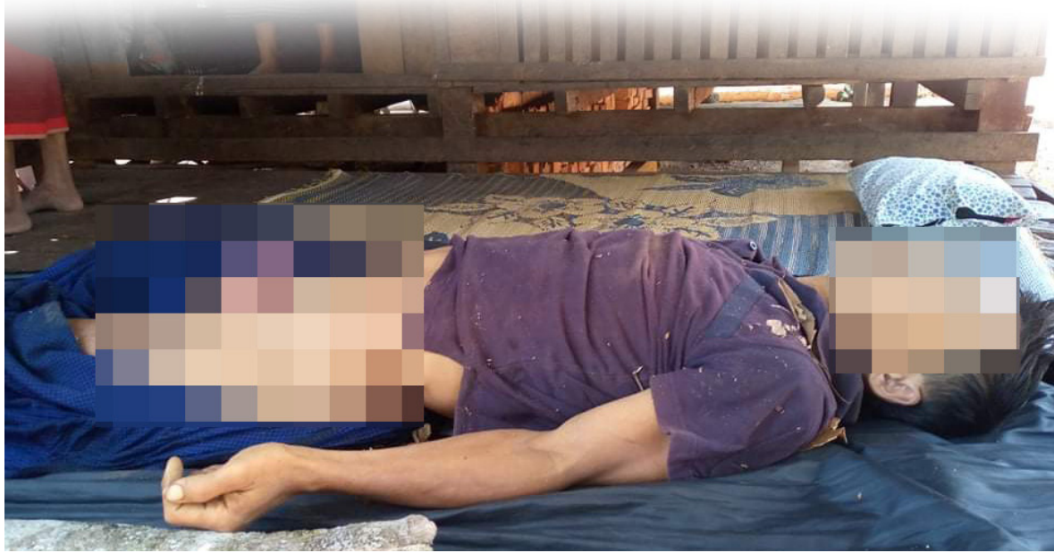
တၢ်ဂီၤတဘျီအံၤ ဟံၣ်ဖျါ ထီၣ် ဝဲ BGF သုးရဲၣ်နီၣ်ဂံၢ် ၁၀၁၄ အိၣ်ဖဲ တဒါအူ (သ့ၣ်ဂီၤပူၤ) သုးကလၢ ခးသံဝဲ သ--- သဝီဖိ တဂၤ လၢတအိၣ်ဒီးတၢ် ဂ့ၢ်တၢ်ကျိၣ်နီၣ်တမံၤဘၣ် ဖဲမံၣ်သ န့ၣ်ကရူၢ် ဖၣ်အိၣ်ကီၢ်ဆၣ် ဒုသထူၣ်ကီၢ်ရဲၣ်ပူၤန့ၣ်လီၤ.

ဟီၣ်ခိၣ်ဒီးဘၣ်လံာ်ဘိးဘၣ်ရၢလီၤ ဘၣ်ဃးပုၤဟီၣ်ခိၣ်ဖိခွဲးယၢ် အစၢဖိ ၃. ပုၤကိးဂၤဒဲး အိၣ်ဒီးအခွဲး အယၢ်လၢ ကအိၣ်မူဘၣ်လၢတၢ်သဘျီ ဒီးတၢ်ဘၣ်တၢ်ဘၢန့ၣ်လီၤ. အစၢဖိ ၅. ပုၤတဂၤလၢလၢတၢ်တဘၣ်မၤအါ မၤသီ, မၤ ဆူး မၤဆါ, မၤဘၣ်ဒိအသုးသ့ၣ်လီၤကပီၤဒီးမၤမံၣ်ဆူးအီၤဘၣ်. အစၢဖိ ၉. ပုၤတဂၤလၢလၢတၢ်တဘၣ်ဖီၣ်နီၤစီၣ်အီၤ, ဒုးယၢ်အီၤလၢ ဃီၣ်ပူၤ ဒီးဟီၣ်ထီၣ်ကွၢ်အီၤလၢထံကီၢ်ပူၤလၢအတဖိဒီးသဲးန့ၣ်ဘၣ်လီၤ. ဒ်ဟီၣ်ခိၣ် ဒီးဘၣ်လံာ်ဘိး ဘၣ်ရၢလီၤဘၣ်ဃးပုၤဟီၣ်ခိၣ်ဖိခွဲးယၢ်ပၤဖျါထီၣ်ဝဲအသိး SAC ပယီၤသုးသ့ၣ်တဖၣ် တလူၤပိာ်မၤထွဲဝဲတၢ်သိၣ်တၢ်သီ တၢ်ဘျီဘၣ် အမံၣ်ညါ အဝဲသ့ၣ်မၤကမၢ်အါထီၣ်ဝဲဘၣ်ဃးဒီး တၢ်မၤသံ, တၢ်ဖီၣ်ဒုးယၢ် ဒီးတၢ်မၤဆါပယွဲထီၣ်ဒါ ကမုၢ်အါအါသီသီသ့ၣ်တဖၣ်အံၤန့ၣ်လီၤ. 📌