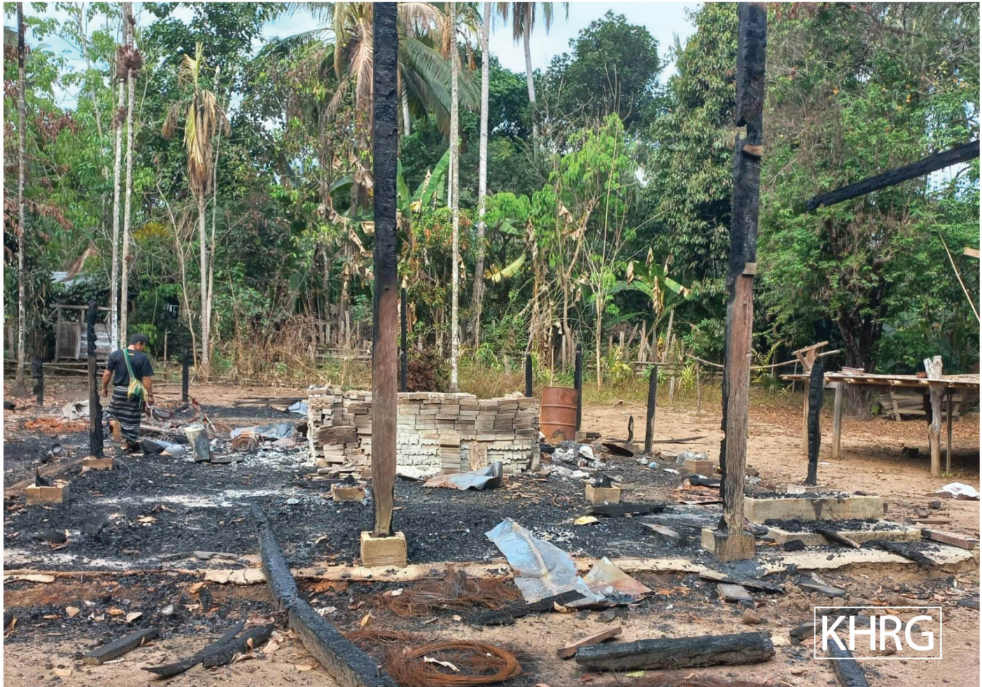
တၢ်ဂီၤတဘျီအံၤ ယဒိန့ၣ်အိၣ်ဖဲ လိယူအါရံၤ ၁၇ သီ, ၂၀၂၃ နှစ်, လုနီၤသဝီ, ကွံၣ်ကဆိကွံၣ်ကရူၢ်, ဝီရံၣ်ကီၢ်ဆၣ်, ဒူပျၢ်ယၢ်ကီၢ်ရံၣ်ပူၤန့ၣ်လီၤ. တၢ်ဂီၤအံၤဟံၣ်ဖျိထီၣ်ဝဲ က မျၢ်အဟံၣ် ဟးဂီၤဝဲဒၣ်ဖျိလၢကဘီယူဟဲးကွံၣ်လီၤ မ့ၣ်ပီၢ်အဖိန့ၣ်လီၤ.

ဖဲလါနိၣ်ဝဲဘၣ် ၁၂ သီ, ၂၀၂၂ နှစ်, မုၢ်ဂီၤဒီ ၅ နှစ်ရံၣ်အဆၢက တီၢ်န့ၣ်, KNDO သးရုၣ် နီၣ်ဂံၢ် (၆) ဒီး PDF သးဟဲးဖျိၣ်တဖၣ် ထီၣ်ခးဝဲပ ယီၤပၤကီၢ်ရူၤတဖျၢ် ဖဲ ဒီန့ၣ်သဝီ, ကြၢၢ်တုၤကီၢ်ဆၣ်, ဒူပျၢ်ယၢ်ကီၢ်ရံၣ် န့ၣ်လီၤ. ဖဲတၢ်ထီၣ်မၤန့ၢ် SAC ပၤကီၢ်အရူ ၂ နှစ်ရံၣ်ဝဲအလီၢ်ခဲန့ၣ် SAC သးအကဘီယူဟဲးခးလီၤဝဲတၢ်ဖဲ ကြၢၢ်ကွဲၤအိၣ်အဆၢ, ကြၢၢ်ကွဲၤကရူၢ်, ကြၢၢ် တုၤကီၢ်ဆၣ်ပူၤန့ၣ်လီၤ. ဒီဖျိလၢကဘီယူ ဒီးတၢ်ခးလိၣ်သးကဲထီၣ် အဖိ ပုၤသဝီဖိသ့ၣ်တဖၣ်ပျံၤတၢ်ဖုးတၢ် ဒီးတနီၤနီၤဟ့ၢ်အိၣ်ကဒုဆူပူၤ ဒီးတနီၤနီၤဟ့ၢ်အိၣ်ဆူအဘူးအတၢ်အဟံၣ်န့ၣ်လီၤ. မ့ၣ်မုၢ်လၢ ဘျဲးဒဝဲၢ်ကီၢ် ရံၣ် ဒီးဖျိအံၤကီၢ်ရံၣ်ပူၤတခါ စးထီၣ်လါအိးကထိဘၣ်, ၂၀၂၂ နှစ် တုၤ လါမးရး, ၂၀၂၃ နှစ်န့ၣ်, SAC ကဘီယူဟဲးခးလီၤတၢ်တအိၣ်နီတဘျီဒီး ဘၣ်န့ၣ်လီၤ. 📌