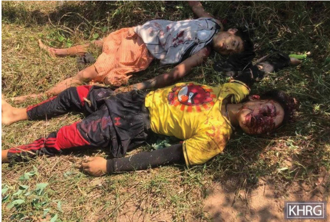
တၢ်ဂီၤအံၤဟံၣ်ဖျါဝဲ ပုၤသံစိၣ်ခံဂၤလၢ အမ့ၢ် ဒိၣ်ရၣ်သဝီဖိ စီၤငပူၤ, ၁၈ နံၣ် ဒီး စီၤယဲဝဲ, ၁၈ နံၣ် လၢအအိၣ်ဖဲ ဒိၣ်ရၣ်ဟီၣ်ကဝီၤ, သထူၣ်ကီၢ်ရၣ်, လၢအဘၣ်တၢ်ခးသံအီၤလၢ ခိၣ်ချ့ သုးရၣ်နီၣ်ဂံၢ်- ၈ အသုးဖိတဖၣ်ဖဲ လဲၤမးရး ၂၄ သီ, ၂၀၂၃ နှစ် ဂီၤခီ ၁၁း၃၀ နှစ်ရံၣ်န့ၣ်လီၤ. (တၢ်ဂီၤ - KHRG)

ခီဖျါလၢတၢ်ကဲထီၣ်သးဒ်အံၤသ့ၣ်တဖၣ်အဃိ သဝီဖိတဖၣ်ပျံၤ လၢ SAC သုးဖိကဖီၣ်န့ၣ်အဝဲသ့ၣ်ဒီးအဝဲသ့ၣ်လဲၤဃုၢ်အိၣ်ဝဲဆူတၢ်လီၤလၢ အဘၣ်ဘၢတဖၣ်အလီၢ်န့ၣ်လီၤ. မ့ၢ်သဝီဖိလၢအဘၣ်တၢ်ဖီၣ်န့ၣ်အီၤတဖၣ် အကျါတနီၤ အဟံၣ်ဖိ ဃီဖိတဖၣ် ဘၣ်လဲၤဟ့ၣ်လီၤကျိၣ်စုလၢကထုးထီၣ် က့ၤအဝဲသ့ၣ်အဂီၢ်န့ၣ်လီၤ. ဘၣ်ဆၣ် တၢ်ကဲထီၣ်သးအကျါတနီၤန့ၣ် SAC သုးဖိတဖၣ် ဖီၣ်တၢ်ဃာ်သဝီဖိဒီး တဒုးနီၤဟူက့ၤဝဲအကစီၣ် တဖၣ်ဘၣ်အဃိဒီး ဟံၣ်ဖိဃီဖိတဖၣ် သူၣ်ကီၢ်သးဂီၤတၢ်ဒိၣ်မး ဒီးမၤတၢ်တသ့နီၣ်တမံၤ ဘၣ်န့ၣ်လီၤ. အဝဲသ့ၣ်သူၣ်ကီၢ်သးဂီၤဝဲ ခီဖျါလၢ SAC သုးတဖၣ် မၤဒၢၣ်မၤ လီၢ်ဒီး မၤသံဝဲသဝီဖိလၢအဖီၣ်န့ၣ်ဝဲသ့ၣ်တဖၣ်ကဲထီၣ်တ့ၢ်လဲၤအသးအိၣ် အဃိန့ၣ်လီၤ. 📄