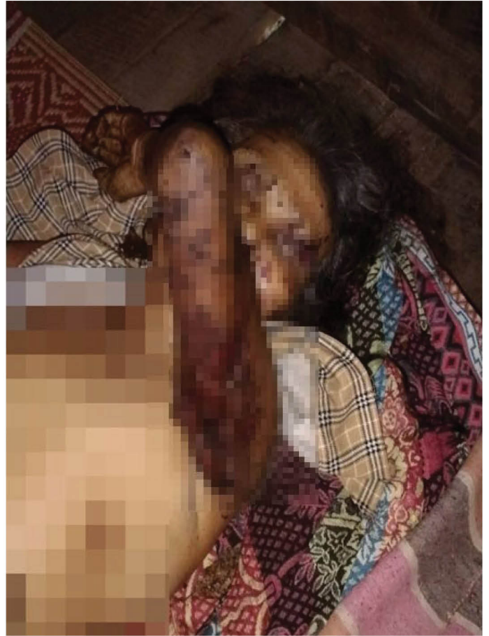
တၢ်ဂီၤသ့ၣ်တဖၣ်အံၤ တၢ်ဒီးန့ၣ်ဘၣ်အိၣ်ဖဲ လါယူအါရံၤ ၂၀၂၃ ဖဲ က---သဝီ, သမိဒီကရူၢ်, ဒိၣ်ဖးခိၣ်ကီၢ်ဆၢၣ်, တီအူကီၢ်ရၣ်န့ၣ်လီၤ. တၢ်ဂီၤအံၤ ဟံၣ်ဖျါထီၣ်ဝဲ ဒီး--- အသံစီၣ် ဖဲအဝဲယီၢ်ဘၣ်ဟီၣ်လၢမ့ၣ်တီၢ် ဘူးဒီး က---သဝီ ဝံၤအလီၢ်ခံ ဖဲလါယူအါရံၤ ၁၃သီ, ၂၀၂၃န့ၣ်န့ၣ်လီၤ. SAC သုးဖိတဖၣ် လဲၤဒီးလီၤ ဟီၣ်လၢမ့ၣ်တီၢ် ဝဲ အံၤဖဲတၢ်ဒုးကဲထီၣ်သးလၢဟီၣ်ကဝီပူၤ ဝံၤအလီၢ်ခံန့ၣ်လီၤ.