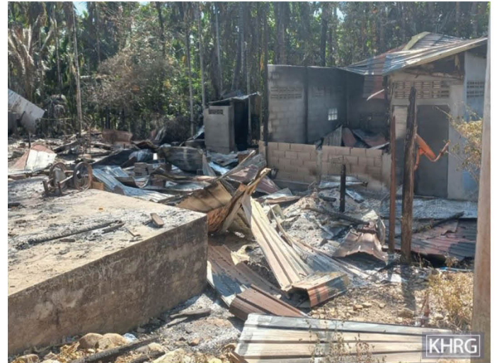
တၢ်ဂီၤသ့ၣ်တဖၣ်အံၤဘၣ်တၢ်ဒိန့ၢ်အီၤဖဲ လိယူအါရံၤ ၁၀ သီ, ၂၀၂၃ နှံ ဖဲ ဝါကူၣ်သဝီ, ထံလၢၤကျဲဟီၣ်ကဝီ, လၢဒိၣ်စိကီၢ်ဆၣ်, ဘျးဒဝဲၣ်ကီၢ်ရၣ်န့ၣ်လီၤ. တၢ်ဂီၤသ့ၣ်တဖၣ်အံၤတၢ်ဂီၤသ့ၣ်တဖၣ်လၢ SAC ဒိၣ်သုးရၣ်နီၣ်ဂံၢ်(၁၈၇-၂၆၇) လၢအအိၣ်ဆီလီၤအသးဖဲ ဒဝဲၣ်တဖၣ်ဒွဲၣ်အူထီၣ် သဝီဖိအဟံၣ် (၁၃)ဖျၢၣ် ဒီး အတၢ်ဖဲးအိၣ်မၤအိၣ်လီၤ အကျဲတနီၤဖဲ လိယူအါရံၤ ၈ သီ, ၂၀၂၃ နှံ ဂီၤဒီ ၇:၀၀န့ၣ်ရံၣ်န့ၣ်လီၤ.

ဖဲလိယူအါရံၤ ၇ သီ, ၂၀၂၃ နှံအနံၤန့ၣ် SAC ဒိၣ်သုးရၣ်နီၣ်ဂံၢ်(၂၆၇) လၢအအိၣ်ဆီလီၤအသးဖဲ ဒဝဲၣ်တဖၣ်ဟံၣ်ဆၢတၢ်အိၣ်ဒီး သုးသီလုၣ် ၆ ခိၣ်ဖဲ အဝဲသ့ၣ် သုးကလၢလၢ အအိၣ်သ့ၣ်လီၤသးဖဲ ထူလၢၤသဝီ, ပီခလိဟီၣ်ကဝီ, ကစၢ်ဒိၣ်ကီၢ်ဆၣ်, ဘျးဒဝဲၣ်ကီၢ်ရၣ် အဆၢကတီၢ် ကမုၢ်တၢ်ဒီးသဒၢသုးဟံၣ်ဖိၣ်တဖၣ် ခးအဝဲသ့ၣ်န့ၣ်လီၤ. လၢတၢ်န့ၣ်အယီၤ ဖဲလိယူအါရံၤ ၈ သီ, ၂၀၂၃ နှံ ဂီၤဒီ ၇:၀၀ န့ၣ်ရံၣ် အဆၢကတီၢ် ဃၢၣ်ဃၢၣ်န့ၣ် SAC သုးဖိတဖၣ် ဒွဲၣ်အူသဝီဖိအဟံၣ်(၁၃)ဖျၢၣ်ဒီး အတၢ်ဖဲးအိၣ်မၤအိၣ်အလီၤအကျဲတနီၤဖဲအအိၣ်လၢ ဝါကူၣ်သဝီ, ထံလၢၤကျဲဟီၣ်ကဝီ, လၢဒိၣ်စိကီၢ်ဆၣ်, ဘျးဒဝဲၣ်ကီၢ်ရၣ်အပူၤန့ၣ်လီၤ.