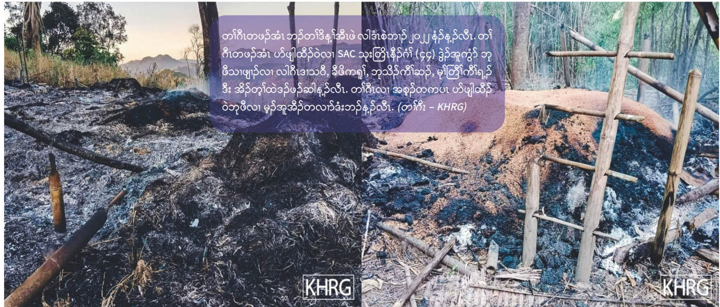
တၢ်ဂီၤတဖၣ်အံၤ ဘၣ်တၢ်ဒိန့ၢ်အီၤဖဲ လါဒဲးစဲဘၣ် ၂၀၂၂ နှစ်န့ၣ်လီၤ. တၢ်ဂီၤတဖၣ်အံၤ ဟံဖျါထီၣ်ဝဲလၢ SAC သုးတြီၤနီၣ်ဂံၢ် (၄၄) ခွဲၣ်အူကွဲၣ်ဘုဖိသၢဖျါလၢ လါဂီၤဒၢသဝီ, ခိဖိကရၢ, ဘုသိၣ်ကီၢ်ဆၣ်, မုၢ်တြီၢ်ကီၢ်ရဲၣ်ပူၤဒီး အိၣ်တၢ်ထဲဒုၣ်ဖၣ်ဆါန့ၣ်လီၤ. တၢ်ဂီၤလၢ အစ့ၣ်တကဖၤ ဟံဖျါထီၣ်ဝဲဘုဖိလၢ မုၢ်အူအိၣ်တလၢဒီးဘၣ်န့ၣ်လီၤ.

တချုးလၢတၢ်ခွဲၣ်အူဒီးဘၣ်ဖဲ လါဒဲးစဲဘၣ် ၉ သီန့ၣ် တၢ်ဒုးကဲထီၣ်လၢ SAC သုးတြီၤနီၣ်ဂံၢ်(၄၄)ဒီး KNLA, KNDO အဘၣ်စၢၤဖဲ သဝီမုၢ်ထီၣ်တပၤဝံၤအလီၢ်ခံမး SAC သုးဖိတဖၣ် ခွဲၣ်အူကွဲၣ်သဝီဖိဘုဖိတဖၣ်န့ၣ်လီၤ.