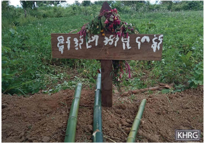
တၢ်ဂီၤသ့ၣ်တဖၣ်အံၤ ဘၣ်တၢ်ဒိန့ၣ်အီၤဖဲ လၢအိးကထိဘၣ် ၂၃ သီ, ၂၀၂၂ နှစ် ဖဲတခိးပုၤသဝီ, တခိးပုၤကရူၢ်, မူကီၢ်ဆၢ, ချၢၣ်လွံၤထူၣ်ကီၢ်ရဲၣ်န့ၣ်လီၤ. တၢ်ဂီၤလၢအထွဲတကပၤမ့ၢ်ဝဲ နီၣ်ဒ့ၣ်ညါအိၣ် လၢဘၣ်တၢ်မၤသံအီၤလၢ SAC သုးဖိတဖၣ်န့ၣ်လီၤ. တၢ်ဂီၤလၢအစ့ၣ်တကပၤမ့ၢ်ဝဲ နီၣ်ဒ့ၣ်ညါအသ့ၣ်ခိၣ်လၢတၢ်ရဲၣ်လီၤအီၤဖဲ ကိဒုတၢ်လီၢ်ယ ဖဲတခိးပုၤသဝီကပၤန့ၣ်လီၤ.

ပုၤ ဒီးခးသံကွံာ်အီၤဖဲစံာ်ပျီပူၤန့ၣ်လီၤ. နီၣ်ဒ့ၣ်ညါအါအံၤ မ့ၢ်လၢအအိၣ်တဆူၣ်ဒီးဃုာ်တကဲဘၣ်အယိအိၣ်တၢ်လၢသဝီပူၤန့ၣ်လီၤ. ကျိချံလၢ SAC အသုးခးသံအီၤန့ၣ် ဘၣ်ဖျိဝဲဒုၣ်အနၢ်ကုလၢအစ့ၣ်တကပၤဖျိဃီဝဲဒုၣ်ဆူအခိၣ်သၢၣ်ဃံဒီးဖျိသၢၣ်ကံၤကွၢ်ဆူအနၢ်ကုအထွဲတကပၤန့ၣ်လီၤ. ဖဲ SAC သုးဖိတဖၣ်ခးသံဝဲ နီၣ်ဒ့ၣ်ညါအါတဂၤအံၤဝဲအလီၢ်ခံ သဝီဖိလၢအိၣ်ဖဲတခိးပုၤသဝီလီၢ်ကဝီၤသ့ၣ်တဖၣ် သၢၣ်ဘၣ်ဝဲတၢ်ဘၣ်တၢ်ဘၣ်လီၤဘၣ်ယိၣ်ဘၣ်ဘျီဒီး တၢ်ပျံတၢ်ဖုးသ့ၣ်တဖၣ်န့ၣ်လီၤ. တၢ်အိၣ်သးဒ်အံၤအယိ သဝီဖိသ့ၣ်တဖၣ် ဘၣ်ဃုာ်ထီၣ်ကွံာ်လၢအဒုသဝီဒီး ပာ်တၢ်ကွံာ်ဝဲအဟံၣ်အယိ, ဆၢဖိကီၢ်ဖိ ဒီးတၢ်စုလီၢ်ခိၣ်ခိၣ်သ့ၣ်တဖၣ်အယိ အဝဲသ့ၣ်သၢၣ်ဘၣ်ဝဲတၢ်လုၢ်အိၣ်နီၣ်ခိၣ်သးသမူအတၢ်တၢ်သ့ၣ်တဖၣ်န့ၣ်လီၤ.