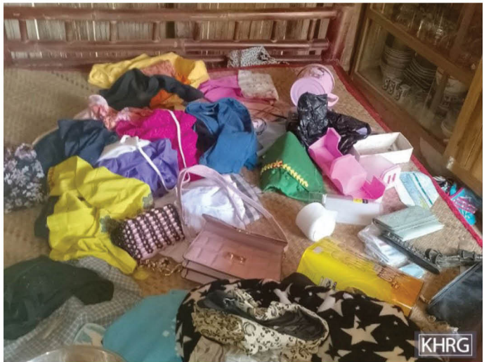
တၢ်ဂီၢ်တဘျီအံၤ ဘၣ်တၢ်ဒိၣ်န့ၣ်အါဖဲ လၢနီၣ်ဝဲဘၣ် ၁၅ သီ, ၂၀၂၂ နှံၣ်ဖဲ ဝါကူသဝီ, ကမိၤသ့ဟီၣ်ကဝီ, လၢဒိၣ်စိကီၢ်ဆၣ်, ဘျးဒဝ်ကီၢ်ရၣ်န့ၣ်လီၤ. တၢ်ဂီၢ်အံၤဟံးဖျါ ထီၣ်ဝဲလၢ SAC သုးဖိတဖၣ် မဲၤလၢသဝီဖိတဖၣ် အဟံၣ်တန့ၣ်ဒီး မၤပြုၤတၢ်ဖိတၢ် လံၤအိၣ်လၢ ဟံၣ်ပူၤန့ၣ်လီၤ.

SAC သုးဖိတဖၣ်တၢ်မၤပျံၤမၤဖုးဒီး သုးဖိတဖၣ်န့ၣ်လီၤအါအါဂီၢ် ကီၢ်လၢသဝီပူၤအဆၢကတီၢ် သဝီဖိတဖၣ်ပျံၤတၢ်ဒိၣ်မးဒီးဃုၢ်ထီၣ်ကွံာ်လၢ သဝီပူၤန့ၣ်လီၤ. ဖဲအဝဲသ့ၣ်ဃုၢ်ထီၣ်လၢသဝီပူၤအဆၢကတီၢ် အတၢ်ဖိတၢ် လံၤလၢအိၣ်တၢ်ဖၣ်ဟါမၤကွံာ် မ့ၢ်လၢ SAC သုးတဖၣ် ဟံးန့ၢ်မၤဟးဂီၤ အါအဆၢန့ၣ်လီၤ. ဖဲလၢနီၣ်ဝဲဘၣ် ၂၀၂၂ နှံၣ်အဆၢကတီၢ် ဒိၣ်ချ့သုးရၣ်နီၣ်ဂံၢ်(၂၅) သုးဖိ ၁၀၀ ဘျီၣ်လၢ အဟံးတုၤလၢ ဒဝ်ဝဲဒုၢ်န့ၣ် န့ၣ်လီၤမဲၤလၢဝါ ကူသဝီဖိအဟံၣ်တဖၣ်အဆၢ သဝီဖိတဖၣ်ဘၣ်ဃုၢ် အိၣ်ကမ့ၢ် လၢပျံၤပူၤန့ၣ် လီၤ. SAC သုးဖိတဖၣ် ဟံးန့ၢ်တၢ်အိၣ်ဒီး တၢ်ဖိတၢ်လံၤလၢတၢ်သ့အါသ့ တဖၣ် ဒ်သိးဆ့ကူဆ့ကၤဒီး သဘံၣ်လီၤဒိတဖၣ် ဖဲလၢသဝီဖိတဖၣ် ဃုၢ် အိၣ်ကမ့ၢ်အဆၢကတီၢ်န့ၣ်လီၤ. တုၤမ့ၢ်ဆ့ၣ်ထီၣ်မး SAC သုးဖိတဖၣ် ဟး ထီၣ် လၢသဝီပူၤန့ၣ်လီၤ. သန့ကွံာ် သဝီဖိလၢ အဟံးကွံာ်အိၣ်လၢသဝီပူၤတ ဖၣ်ဘၣ်သဂၢ်ဒီး တၢ်ကီၢ်တၢ်ခဲ မ့ၢ်လၢအဝဲသ့ၣ် ကဖီအိၣ်တၢ်အဂီၢ် တၢ်အိၣ် ဒီးသဘံၣ်လီၤဒိတဖၣ် တအိၣ်ဘၣ်အဆၢန့ၣ်လီၤ.