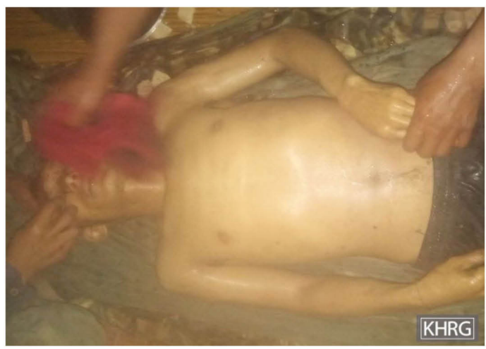
တၢ်ဂီၤတဘျီအံၤ ဘၣ်တၢ်ဒိန့ၣ်အီၤဖဲ လၢဖျါတြုၤအါရံၤ ၈ သီ, ၂၀၂၃ နှစ် ဖဲသဝီဖိလဲၤဃုာ်အိၣ်ကမ့ၢ် အလီၢ်တတီၤ လၢ လီၤပုၤခံသဝီ, စီၤမ့ၢ်ပျီကရူၢ်, လုၢ်သီကီၢ်ဆၢ, မ့ၢ်တြီၢ်ကီၢ်ရဲၣ်လီၤ. တၢ်ဂီၤတဘျီအံၤဟံၣ်ဖျိဝဲ စီၤမီၢ်န့ၣ်အသံစိၣ် လၢဘၣ်တၢ်ခးသံအီၤလၢ SAC သုး ဖဲအလဲၤဃုးအိၣ် တၢ်မဲၤလဲၤလၢပုၤကျိအခါန့ၣ်လီၤ. (တၢ်ဂီၤ -KHRG)

ဖဲလၢဒိၣ်စဲဘၣ် ၃၁ သီ, ၂၀၂၂ နှစ် ဂီၤခီ ၇း၀၀ နှစ်ရံၣ်န့ၣ် SAC ခိၣ်ချ့သုးရ့ၣ် (ခမရ-၄၁၃) လၢအအိၣ်ဆီလီၤသးဖဲ ထီၣ်ဘီၤ ကံၤသုးကလၢၤန့ၣ် ခးသံဝဲ သဝီဖိ စီၤအီၤသူၤရၣ်သါ သးန့ၣ် ၃၄ နှစ် ဖဲအလဲၤလၢကျဲဆူဝုၢ်တီအူ ဒ်သိးကပုၤ တၢ်အိၣ် တၢ်အီၤလၢဟံၣ်ဖိဃီဖိအဂီၢ်အခါန့ၣ်လီၤ. စီၤအီၤသူၤရၣ်သါ မ့ၢ်သဝီဖိတဂၤလၢအအိၣ်ဆိးဖဲ ကဝီၤဒု- ၅ အိၣ်ဖိး (အုတ်ဖို) တၢ်ပူၤသဝီ. တၢ်ပူၤဟီၣ်ကဝီၤ ဒိၣ်ဖးခိၣ်ကီၢ်ဆၢ. တီအူကီၢ်ရဲၣ်န့ၣ်လီၤ. အဝဲတသ့ၣ်ညါဆိဝဲလၢ တၢ်ဒုးကဲထီၣ်လၢ SAC ဒီး လီၢ်ကဝီၤသုးဖိၣ်စုကဝဲတဖၣ် အဘၣ်စၢၤဘၣ်အယိ အဝဲလဲၤတၢ်ဒီး သိလ့ၣ်ယီၢ် ဒီး ဖဲအတုၤလၢ သုးကလၢၤ အမဲၣ်ညါအခါ န့ၣ်ဘၣ်တၢ်ခးသံအီၤန့ၣ်လီၤ. ဖဲစီၤအီၤသူၤရၣ်သါဘၣ်တၢ်ခးအီၤဝဲတဘျီဃီ သဝီဖိလၢအအိၣ်ဟံၣ်ဘူး ဖဲတၢ်ကဲထီၣ်သးအလီၢ်တဂၤ ဟဲတံၢ်ထီၣ်အီၤဒီး ကိးလီၤလီၤတဲစိဆူ ပုၤဂ့ၢ်ဝီတၢ်မၤစၢၤကရၢအသိလ့ၣ် ဒ်သိးကပာ်မၤ စၢၤအီၤအဂီၢ် ဘၣ်ဆၢ ခိၣ်ပျီလၢ စီၤအီၤသူၤရၣ်သါ ဘၣ်ဒိဒီးကျိချံန့ၣ်အယိ အသးသမူဟးထီၣ်ကွံာ်ဝဲန့ၣ်လီၤ. ပုၤတူၢ်ဘၣ်တၢ်အဟံၣ်ဖိဃီဖိ ဘၣ်ဟ့ၣ်လီၤဝဲ SAC တီအူပၤကီၢ်ဝဲၤဒါးနီၣ်ဂံၢ်-၃ စုၣ်ကလီၢ်ကူး ဒ်သိးကန့ၣ်ဘၣ်က့ၤ အစိၣ်အံၤအဂီၢ်န့ၣ်လီၤ. တကးဒ်ဘၣ် SAC တီအူပၤကီၢ်ဝဲၤဒါးနီၣ်ဂံၢ်-၃ အပုၤဘၣ်မူဘၣ်ဒါ ကိးဃီဖျိကိး လီၤတဲစိဆူ ပုၤတူၢ်ဘၣ်တၢ် အဟံၣ်ဖိဃီဖိအအိၣ်ဒီး တဲဘၣ်အဝဲသ့ၣ်လၢ သဝီဖိအသံတဂၤအံၤ အလံာ်နီၣ်သိလ့ၣ်မ့ၢ်ဂ့ၤ အသိလ့ၣ်လံာ်ပျဲမ့ၢ်ဂ့ၤ တအိၣ်ဘၣ်အယိ ကဘၣ်ဟ့ၣ်ဝဲစ့အိၣ်လိး ၄ ကလီၢ်ကူးန့ၣ်လီၤ.