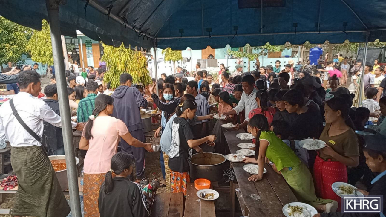
၂၀၂၁ ခုနှစ်၊ ဒီဇင်ဘာလအလယ်လောက်တွင် လေးကေကော်တွင် ဖြစ်ပွားခဲ့သော တိုက်ပွဲများကြောင့် IDP ဦးရေတစ်ထောင်ကျော်သည် ဒူးပလာယာခရိုင်၊ ကော်တရီမြို့နယ်ရှိ ဖလူးကြီးအထက်တန်းကျောင်းတွင် လာရောက်ခိုလှုံခဲ့သည်။ ဤပုံကို ၂၀၂၁ ခုနှစ်၊ ဒီဇင်ဘာလ ၁၈ ရက်နေ့တွင် ရိုက်ယူခဲ့သည်။ ပုံတွင်မြင်တွေ့ရသည့်အတိုင်း IDP များသည် ဒေသခံလူမှုအသိုက်အဝန်းများနှင့် CSO/CBO အဖွဲ့အစည်းများမှပို့ဆောင်လာသော အရေးပေါ်အကူအညီများကို လက်ခံရရှိခဲ့သည်။