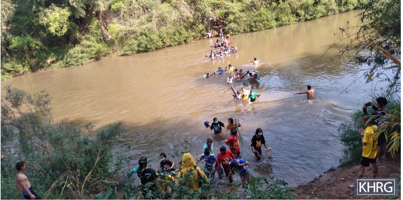
သေဘောဘိုး (တောနေော်)အထက်တန်းကျောင်းမှ ကျောင်းသား၊ ကျောင်းသူများသည် ၎င်းတို့ရွာတွင် လက်နက်ကြီးပစ်ခတ်မှုနှင့် တိုက်ပွဲဖြစ်ပွားခဲ့သောကြောင့် ထိုင်းနိုင်ငံသို့ ထွက်ပြေးတိမ်းရှောင်ခဲ့သည်။ သို့သော် ထိုင်းအာဏာပိုင်များမှ ထိုင်းနိုင်ငံတွင်နေထိုင်၍မရနိုင်ဟု ၎င်းတို့အားပြောကြားခဲ့သည်။ ၂၀၂၁ ခုနှစ်၊ ဒီဇင်ဘာလ ၂၃ ရက်နေ့တွင် ကျောင်းသား၊ ကျောင်းသူများသည် သေဘောဘိုးရွာသို့ ပြန်လာခဲ့ရသည်။