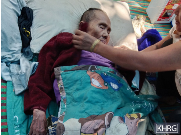
ဤပုံကို ၂၀၂၁ ခုနှစ်၊ ဒီဇင်ဘာလ ၂၄ ရက်နေ့၌ နူးပလာယာခရိုင်၊ ကော်တရီမြို့နယ်၊ ဖလူးလေးကျေးရွာအနီးရှိ IDP စခန်းတစ်ခုတွင် ရိုက်ယူခဲ့သည်။ တိုက်ပွဲကြောင့် ထွက်ပြေးတိမ်းရှောင်နေစဉ်အတွင်း တွင် သက်ကြီးရွယ်အိုများသည် ပို၍အကူအညီလိုအပ်နေသူများ ဖြစ်သည်။ ပုံတွင်ပြထားသည့်အတိုင်း အသက်ကြီးသည့်အဖိုးအိုတစ်ဦးသည် နေရပ်စွန့်ခွာနေရပြီး တစ်လကြာပြီးနောက် IDP စခန်းတွင်သာ ဆုံးပါးသွားခဲ့သည်။