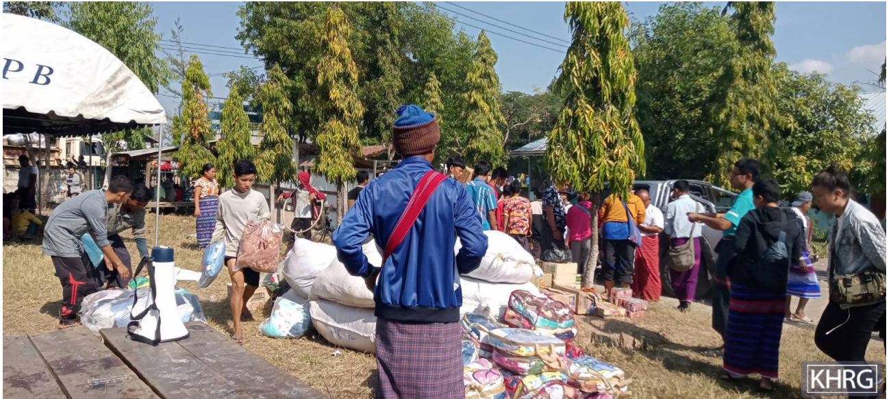
၂၀၂၁ ခုနှစ်၊ ဒီဇင်ဘာလအတွင်း လေးကေကော်ဒေသတွင် တိုက်ပွဲများဖြစ်ပွားပြီးနောက် ဒူးပလာယာခရိုင်၊ ကော်တရီမြို့နယ်ရှိ ဖလူးကြီးအထက်တန်းကျောင်းသည် စစ်ပြေးရှောင်ရွာသားများအတွက် အရေးပေါ်အကူအညီပေးရန် အရေးပါသည့်နေရာတစ်ခုဖြစ်လာခဲ့သည်။ ဒေသခံလူမှုအသိုက်အဝန်းများနှင့် ထိုင်း-မြန်မာနယ်စပ်တွင်အခြေစိုက်သည့် CSO/CBO အဖွဲ့အစည်းများမှ စစ်ပြေးရှောင်ရွာသားများအား ကူညီထောက်ပံ့မှုများပေးခဲ့သည်။

ဤအစီရင်ခံစာတွင် ကရင်ပြည်နယ်၏ မြေပြင်အခြေအနေအပါအဝင် ရွာသားများနှင့် လူမှုအသိုက်အဝန်းမှ လိုအပ်ချက်များအား ဖော်ပြထားပါသည်။ ထို့အပြင် ၎င်းတို့အား ကူညီထောက်ပံ့မှုများအားပေးရန် ကြိုးပမ်းနေသည့်အဖွဲ့အစည်းများ၏ အားထုတ်မှုများနှင့် ကြုံတွေ့နေရသည့်စိန်ခေါ်မှုများကိုပါ ထည့်သွင်းဖော်ပြထားပါသည်။ ထို့နည်းတူ လူသားချင်းစာနာထောက်ထားမှုဆိုင်ရာ အကူအညီတွင် ပါဝင်လုပ်ဆောင်သူများအနေဖြင့် အကူအညီပေးနိုင်မည့်နည်းလမ်းများအား မည်ကဲ့သို့ အကောင်အထည်ဖော်နိုင်သည်ကို ကောင်းမွန်စွာအကဲဖြတ်နိုင်ရန်အတွက် လက်ရှိအကူအညီပေးသည့်အဖွဲ့အစည်းများမှ ၎င်း၏ပစ်မှတ်ထားသည့် အကူအညီလက်ခံရရှိသူများထံ ထိရောက်စွာရောက်ရှိမှုအပေါ် ဟန့်တားထားသည့် အဓိကထောက်ပံ့ပို့ဆောင်ရေးနှင့် လုံခြုံရေးဆိုင်ရာ အတားအဆီးများကိုလည်း လေ့လာသုံးသပ်ထားပါသည်။ ဤအစီရင်ခံစာတွင် ဒေသခံအဖွဲ့အစည်းများ၏ ကြိုးပမ်းအားထုတ်မှုများနှင့် ပဏာမခြေလှမ်းများသည် လှစ်ဟာမှုများအား မည်သို့ဖြည့်ဆည်းပေးနေသည်ကို ထည့်သွင်းဖော်ပြထားပါသည်။ ထို့အပြင် ဒေသခံအဖွဲ့အစည်းများလုပ်ဆောင်နေသည့်လမ်းကြောင်းများကို အသိအမှတ်ပြုသင့်ပြီး ၎င်းတို့၏ရင်းနှီးမြှုပ်နှံမှုများသည် လက်ရှိလိုအပ်ချက်များဖြေရှင်းရာတွင်သာမက ရေရှည်တွင် ပိုမိုရေရှည်တည်တံ့သောယန္တရားများကို ပံ့ပိုးပေးခြင်းဖြင့် ပိုမိုထိရောက်သောနည်းလမ်းများပါ မီးမောင်းထိုးပြထားပါသည်။