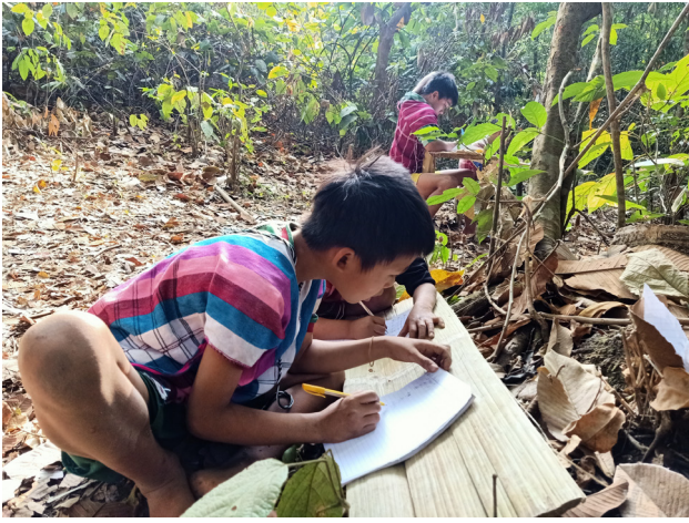
၂၀၂၀ ခုနှစ်၊ ဒီဇင်ဘာလကတည်းကစပြီး ခလယ်လွှီထူခရိုင်၊ လယ်ဒိုမြို့နယ်၊ ခဲဒဲကျေးရွာအုပ်စုမှ ရွာသားများသည် နေရပ်စွန့်ခွာတိမ်းရှောင်နေရပြီးဖြစ်သည်။ ၂၀၂၁ ခုနှစ်၊ မတ်လအထိ ထွက်ပြေးတိမ်းရှောင်နေရသည့်ကလေးများသည် တောထဲတွင်သာ ဆက်လက်ပညာဆည်းပူးနေဆဲဖြစ်သည်။