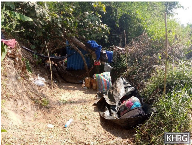
၂၀၂၂ ခုနှစ်၊ မတ်လ ၂၇ ရက်နေ့၌ မူကြော်ခရိုင်၊ လူသောမြို့နယ်၊ ဒေဘူးနီဒေသတွင် SAC စစ်တပ်မှ လေကြောင်းဖြင့်တိုက်ခိုက်မှု ပြုလုပ်ခဲ့သည်။ ဤပုံကို ၂၀၂၂ ခုနှစ်၊ ဧပြီလ ၉ ရက်နေ့တွင် ရိုက်ယူခဲ့သည်။ ပုံတွင် ရွာသားများသည် လေကြောင်းတိုက်ခတ်မှုကြောင့် ထွက်ပြေးတိမ်းရှောင်နေခဲ့ရပြီး တောထဲရှိဂူထဲတွင် ယာယီစခန်းချခဲ့သည်။