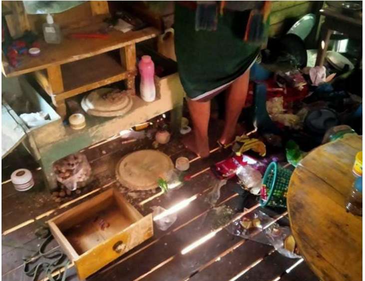
ခူးပလာယာခရိုင်၊ ကော်တရီမြို့နယ်၊ အောဖကြီးကျေးရွာအုပ်စုတွင် လှုပ်ရှားနေသော SAC စစ်သားများသည် ရွာသားများမှ ဒေသအတွင်း တိုက်ပွဲများဖြစ်ပွားဖြစ်ခဲ့သောကြောင့် ၎င်းတို့ရွာမှ ထွက်ပြေးတိမ်းရှောင်နေသည့်အချိန်တွင် ရွာသားများ၏အိမ်များတွင်လည်း ဝင်ရောက်နေထိုင်ခဲ့ပြီး ယာယီအိပ်ယာခင်းများပြုလုပ်၍ ရွာသားများပိုင်ဆိုင်သည့်ပစ္စည်းများကို အသုံး၍ စားစရာများ ချက်ပြုတ်စားသောက်ခဲ့သည်။ SAC စစ်သားများသည် ရွာသားများ၏ပိုင်ဆိုင်မှုပစ္စည်းများကိုလည်း ဖျက်ဆီးခဲ့သည်။ ဤပုံကို ၂၀၂၂ ခုနှစ်၊ မတ်လ ၄ ရက်နေ့တွင် ရိုက်ယူခဲ့သည်။

“အားလုံးက စားနပ်ရိက္ခာမလုံလောက်မှုနဲ့ ရင်ဆိုင်နေရတယ်လို့ ကျွန်တော်ထင်တယ်။ ဘာကြောင့်လဲဆိုတော့ ကျွန်တော်တို့တွေ ခရီးသွားလာလို့မရတော့ ဘာအလုပ်မှလုပ်လို့မရဘူး။ [...] ရွာသား တွေက သူတို့သိမ်းထားတဲ့ စားစရာတွေကိုပဲ စားကြရတယ်။ သူတို့က စားစရာတွေကို မနှစ်က လမ်းမပိတ် ခင်ဝယ်ထားတယ်။ မနှစ်ကသိမ်းထားတဲ့ စားစရာအချို့ရှိသေးတယ်။ အဲဒါကုန်ရင်တော့ ဘယ်လိုဆက်လုပ် ရမလဲ သူတို့မသိဘူး။ [...] တချို့ရွာသားတွေ အတွက် အစားအသောက်က ကုန်သွားပြီ။” - မူကြော်ခရိုင်၊ ဒွယ်လိုးမြို့နယ်၊ မာထောကျေးရွာအုပ်စုမှ ရွာသားတစ်ဦး