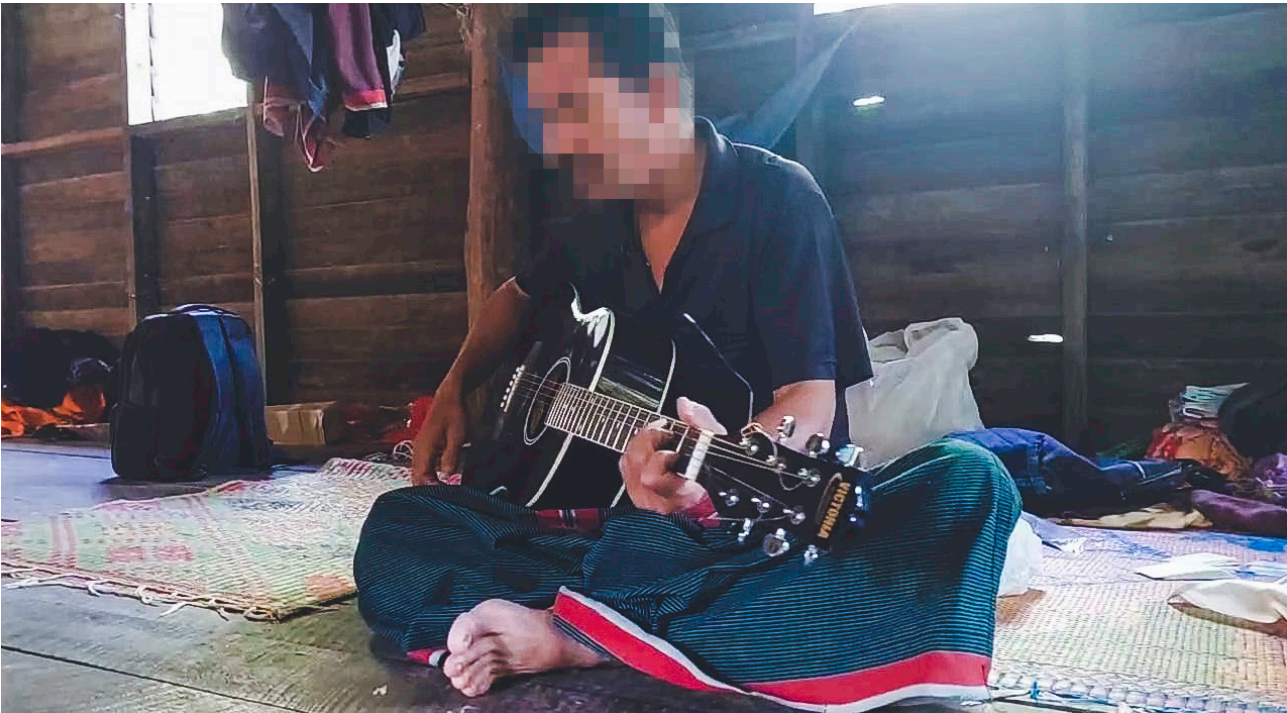
ဤပုံကို ၂၀၂၂ ခုနှစ်၊ နိုဝင်ဘာလ ၆ ရက်နေ့၌ ဘားအံခရိုင်၊ လူပလယ်မြို့နယ်၊ ကဟ--- ကျေးရွာတွင်ရိုက်ယူခဲ့သည့် အဓမ္မ ပျောက်ဆုံးစေခြင်းခံရသော လူ့အခွင့်အရေးကာကွယ်စောင့်ရှောက်သူတစ်ဦးဖြစ်သည့် စောယ--- အား လူ့အခွင့်အရေးအလုပ်ရုံ ဆွေးနွေးပွဲကို မတက်ရောက်မီအားလပ်ချိန်တွင် ပျော်ရွှင်စွာသီချင်းဆိုနေသည်ကို ဖော်ပြထားပါသည်။ စောယ---သည် ၂၀၂၃ ခု နှစ်၊ ဖေဖော်ဝါရီလ ၂ ရက်နေ့တွင် SAC ၏ အဓမ္မပျောက်ဆုံးစေခြင်း ခံခဲ့ရပါသည်။