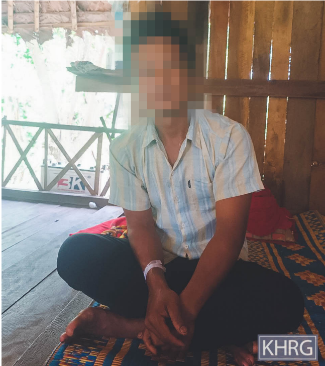
ဤပုံကို ၂၀၂၃ ခုနှစ်၊ ဇူလိုင်လ ၂၅ ရက်နေ့တွင် ဒူးပလာယာခရိုင်၊ ကော် တရီမြို့နယ်၊ နို့ဖိုးကျေးရွာအုပ်စု၊ စအ---ကျေးရွာတွင် ရိုက်ယူ ခဲ့ပါသည်။ ဤပုံသည် ၂၀၂၃ ခုနှစ်၊ ဇန်နဝါရီလ ၆ ရက်နေ့တွင် ပျောက်ဆုံး သွားပြီး ပြင်းထန်စွာညှဉ်းပမ်းနှိပ်စက်ခြင်းခံရသည့် စောဒ--- ဖြစ်သူ ပြန်လည် လွတ်မြောက်လာပြီး နောက်ပိုင်း ၎င်း၏ပုံဖြစ်ပါသည်။

၂၀၂၁ ခုနှစ် အာဏာသိမ်းပြီးနောက် အရပ်သားများအပေါ် ကျူးလွန်သည့် လူ့အခွင့်အရေးချိုးဖောက်မှုများထဲမှ အတင်းအဓမ္မပျောက်ဆုံးစေမှုအား SAC မှ နိုင်ငံရေးအရဖိနှိပ်သည့် ဗျူဟာတစ်ခုအဖြစ်အသုံးပြုပြီး အာဏာသိမ်းမှုကို ဆန့်ကျင်သည့်လှုပ်ရှားမှုများနှင့် ဆက်နွယ်နေသည်ဟု သံသယရှိသောရွာသားများအား ပစ်မှတ်ထားခဲ့သည်။ ရွာသားများသည် SAC ၏အဓမ္မဖမ်းဆီးခြင်း၊ ချုပ်နှောင်ခြင်းနှင့် အတင်းအဓမ္မပျောက်ဆုံးစေခြင်းများကို ခံကြရသည်။