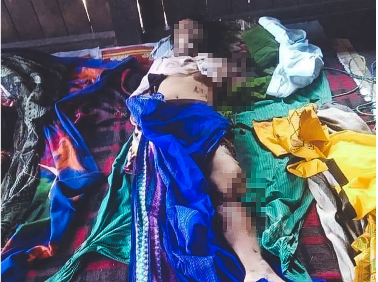
တၢ်ဂီၤတဘျီအံၤ ဘၣ်တၢ်ဒီးန့ၢ်အိၤ ဖဲလၢမးရှး ၁ သီ, ၂၀၂၁ နံၣ် ဖဲထလ--- သဝီ, ယဲကၢ်ခိၣ်ကရူၢ်, လၢဂၢ်ခိၣ်ကီၢ်ဆၢ, ချၢၣ်လွံၤထူကီၢ်ရၣ်န့ၣ်လီၤ. တၢ်ဂီၤ အံၤဟံၤဖျါထီၣ်ဝဲ သဝီဖိ ၇၁သံ ဒိဖျါအဘၣ်မ့ၢ်ဖိ ဖဲလၢမးရှး ၁ သီ, ၂၀၂၁ နံၣ် န့ၣ်လီၤ.