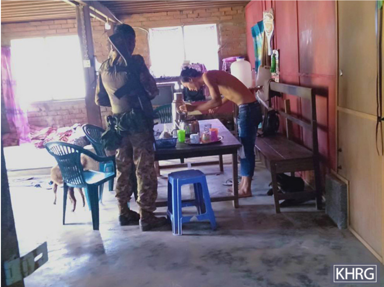
တၢ်ဂီၤတဘျီအံၤ ဘၣ်တၢ်ဒီးန့ၣ်အီၤ ဝဲလၢအုၣ်ဖျိၣ် ၂၅ သီ, ၂၀၂၁ နံၣ် ဝဲဂယ--- သဝီ, ဂယ---ကရူာ်, ဒိၣ်ဖးခိၣ်ကီၢ်ဆၢၣ်, တိအူကီၢ်ရၣ်န့ၣ်လီၤ. တၢ်ဂီၤအံၤ ဟံၣ်ဖျါထီၣ်ဝဲ(စကစ)သးမိၤစိရီၤ ခိၣ်ချ့သးရၣ် (၇၃၀) ဟံးန့ၣ်ကျဲတၢ်ဘၣ်တၢ်ဘၢအခါ အသးဖိတဖၣ် န့ၣ်လီၤလၢသဝီဖိအဟံၣ်ဒီးယုသဝီဖိတၢ်အိၣ်တၢ်အိၣ်န့ၣ်လီၤ. သဝီဖိတဖၣ် ပျံတၢ်ဒီးဘၣ်ယိၣ်လၢသးမိၤစိရီၤတဖၣ် ကမၤအမၤသီဘၣ်ဖုး အဝဲသ့ၣ်တမံၤမံၤန့ၣ်လီၤ.