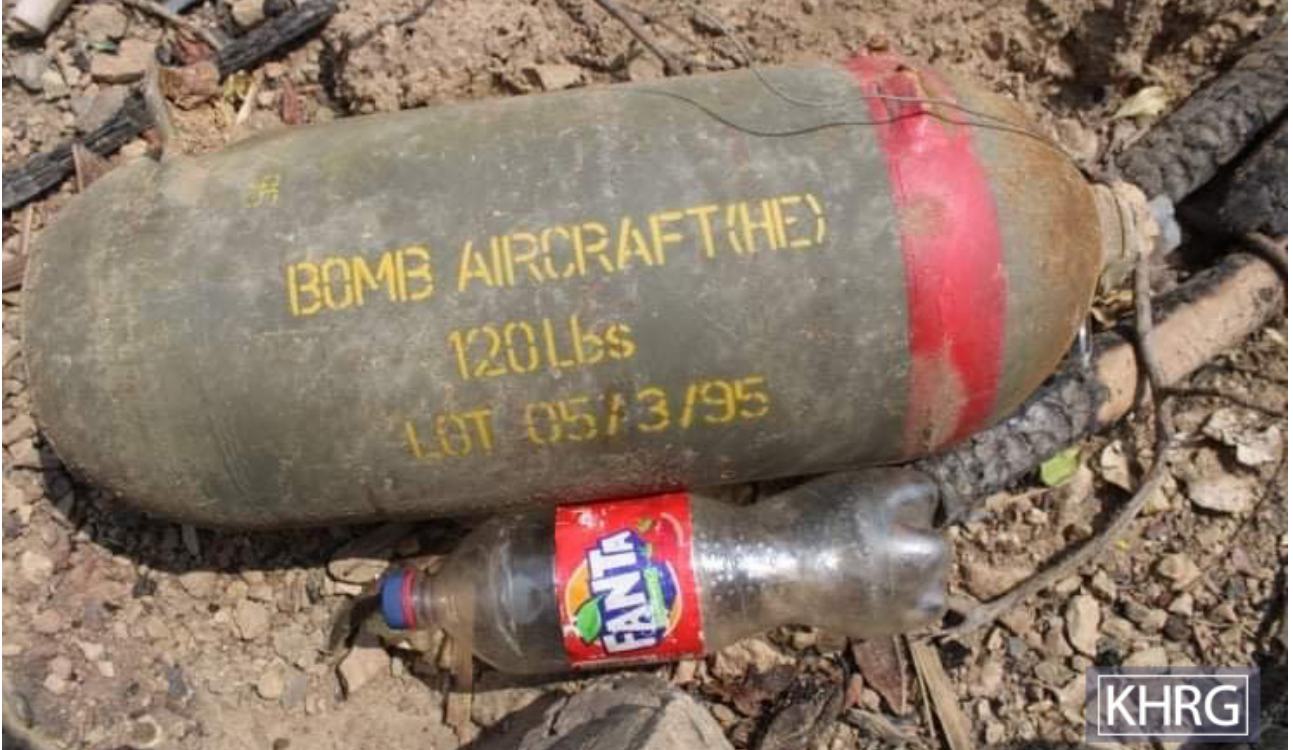
တံဂီတဘုင်အံၤ ဘုင်တံခိန့ၢ်အီၤဖဲ လါအူဖျုၣ် ၂၀၂၁ နံၣ် ဖဲဒုၣ်ဘူးနိၣ်သဝိ, ပုက့ကရုၢ်, လုာ်သီကီၢ်ဆၣ်, မုၢ်တြီၢ်ကီၢ်ရုၣ်အပူၤန့ၣ်လီၤ. တံဂီတဘုင်အံၤ မုၢ်ဝဲကျိဖးဒိၣ်ချံလါအတပိာ်ဖးထီၣ်ခိးဘုင်တဖျုၣ် လါအလီၤတံၣ်ဖဲ SAC သုးမိစီရိတ်အကဘိယုာ်ဟဲခးလီၤတံၣ်ဖဲ ဖဲလါမးရှး ၂၇ သီ, ၂၀၂၁နံၣ်န့ၣ်လီၤ.