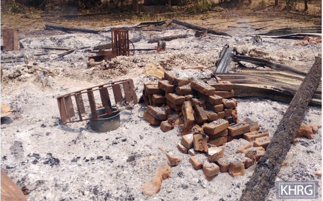
တံဂီတဘုင်အံၤ ဘုင်တံခိန့ၢ်အီၤဖဲ လါအူဖျုၣ် ၂၀၂၁ နံၣ် ဖဲဒုၣ်ဘူးနိၣ်သဝိ, ပုက့ကရုၢ်, လုာ်သီကီၢ်ဆၣ်, မုၢ်တြီၢ်ကီၢ်ရုၣ်န့ၣ်လီၤ. တံဂီအံၤဟံဖျါထီၣ်ဝဲ တံမာဟးဂီၤသဝိဖိတဖၣ် အဟံၣ်အသီခိးအတံဖိတ်လံၤလါအဟးဂီၤတဖၣ် ခိဖျိ SAC သုးမိစီရိတ်အကဘိယုာ်တဖၣ်ဟဲခးလီၤမုၢ်ပိာ် ဖဲလါမးရှး ၂၇ သီ, ၂၀၂၁နံၣ်န့ၣ်လီၤ.