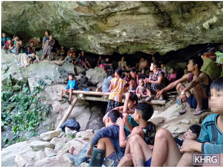
တၢ်ဂီၤတဘျီအံၤ ဘၣ်တၢ်ဒိန့ၢ်အိၤ ဝဲလါမးဂၤ ၁ သိ, ၂၀၂၁ နံၣ် ဝဲ ထအ--- ကရူာ်, ဘုသိၣ်ကီၢ်ဆၣ်, မုာ်တြီၢ်ကီၢ်ရၣ်န့ၣ်လီၤ. တၢ်ဂီၤအံၤဟံၣ်ဖျါးထီၣ်ဝဲ သဝီဖိလုာ်ဒီးဖိသၣ်လၢအဘၣ်ယုာ်မံၤဖျါး ဒီးယုာ်အိၣ်ခူသ့ၣ်လၢလုပုၤ ခိဖျါး SAC သုးမိၤစိရိၤကဘီယုၤသုး ဟဲခးလီၤကျိဖးဒိၣ်လၢအဝဲသ့ၣ်ဟီၣ်ကဝီၤပုၤ ဝဲ လါအုၣ်ဖြၣ် ၂၇ သိ, ၂၀၂၁နံၣ်န့ၣ်လီၤ. (တၢ်ဂီၤ - KHRG)

တၢ်ဂီၤတဘျီအံၤ ဘၣ်တၢ်ဒိန့ၢ်အိၤ ဝဲလါအုၣ်ဖြၣ် ၁၁ သိ, ၂၀၂၁ နံၣ် ဝဲလိာ်လိာ်ကျိကီၢ်ကီၢ်တၢ်တကပၤန့ၣ်လီၤ. တၢ်ဂီၤအံၤ ဟံၣ်ဖျါးထီၣ်ဝဲ သဝီဖိလၢအဘၣ်ယုာ်မံၤဖျါးအကျါတဂၤ ဘၣ်ယုာ်အိၣ်ခူသ့ၣ်လၢ ပုၤပုၤအဆၢတတီၢ်န့ၣ်လီၤ. ဖုသးပုၤတဂၤအံၤ အသးနီၣ်အိၣ် ၁၀၀ ဒီးအိၣ်တဆူၣ်ဘၣ်န့ၣ်လီၤ. အဝဲလုးထီၣ်ယၢတဘျီအံၤ ဘၣ်အါဒီးဘၣ်မံၤနီၤဝဲလၢချိၣ်ဖိဆဲးဆဲးဖိတဘျီအုၣ်န့ၣ်လီၤ. ဖုသးပုၤအမါစ့ၢ်ကိး သးပုၤလံအယံ ပုၤလၢကကွၢ်ထွဲအိၣ်တအိၣ်ဘၣ်န့ၣ်လီၤ. စ့ၢ်န့ၣ်ဝဲအလီၢ်ခံ ဖုသးပုၤအံၤ အသးသမုၤလးထီၣ်ကွံာ်ဝဲဒၣ်န့ၣ်လီၤ. (တၢ်ဂီၤ - KHRG)