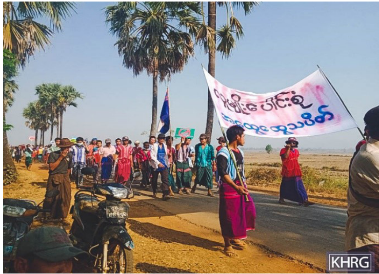
တၢ်ဂီၤတဘျီအံၤ ဘၣ်တၢ်ဒီးန့ၣ်အီၤ ဖဲလိမးၤ ၂၂သီ, ၂၀၂၁ န့ၣ်န့ၣ်လီၤ. တၢ်ဂီၤအံၤဟံၣ်ဖျါထီၣ်ဝဲ သဝိဖိအဂၤ ၅၀၀ လၢကရၢ လွံၤဘၣ်လၢအမ့ၢ် (တခါးပုၤ, ဝုၤစ့, ကိနဲၤ ဒီးနီၣ်ညၣ်လၢၣ်)တဖၣ် ဟံၣ်ဖျါထီၣ်သကိးအသးဒီး တၢ်ဟံၣ်ဖျါထီၣ်တၢ်ဘၣ်သးထီၣ်ဒါသုး မိစိရိန့ၣ်လီၤ. အဝဲသ့ၣ်စးထီၣ်ဟးသကိးဝဲ ဖဲတခါးပုၤသဝိ ဒီး လဲၤဝုၤဝဲတုၤအီၤလီၤစံၣ်, ဝုၤစ့ဒီးကွဲၤပုၤစူၣ်သဝိတဖၣ်အကဝိၢ် ကပၤ ဖဲပျီတုၤဟီၣ်ကဝိၤ, မူကီၢ်ဆၢၣ်, ချၢၣ်လွံၤထူၣ်ကီၢ်ရုၣ်န့ၣ် လီၤ. တၢ်ဟံၣ်ဖျါထီၣ်တၢ်ဘၣ်သးတဘျီအံၤ စံးဝဲလီၤတၢ်လီၤဆဲး လၢအမ့ၢ်ကလုာ်န့ၣ်တဖၣ် အတၢ်ဟံၣ်ဖျါထီၣ်တၢ်ဟံးသးထီၣ်ဒါသုး မိစိရိန့ၣ်လီၤ.

လံၣ်တၢ်ဟံၣ်ဖျါတဘျီအံၤအပူၤ ပၣ်ယုၢ်စ့ၢ်ကိး တၢ်ဂ့ၢ်တၢ်ကျိၤလၢ KHRG ပျီပူၤပုၤထၢတၢ်ကစီၣ်ဖိတဖၣ် မၤနီၣ်မၤယါတ့ၢ်ဝဲဖဲဟီၣ်ကဝိၤ လၢ KHRG ဟူးဂဲၤတဖၣ်အပူၤန့ၣ်လီၤ. တၢ်ဂ့ၢ်တၢ်ကျိၤတဖၣ်အံၤ တၢ်မၤနီၣ်မၤယါအီၤတၢ်ဆၢကတီၢ်တက့ၢ်မ့ၢ်ဝဲ ဖဲသုးမိစိရိဟံးန့ၣ်ဆူၣ် တၢ်စိတၢ်ကမိၤ ယုၤလၢအတီၢ်ပူၤ စးထီၣ်ဖဲလိဖၤတြုၤအါရံၤထီၣ်သီ တုၤလၢယုၤလံၣ်အကတၢ်တန့ၣ်န့ၣ်လီၤ. လၢလံၣ်တၢ်ဟံၣ်ဖျါတဘျီ အံၤအပူၤ တၢ်သုးတၢ်ဂ့ၢ်တၢ်ကျိၤလၢတၢ်မၤနီၣ်မၤယါတ့ၢ်အီၤအါန့ၣ်ဒီး ၁၀၀ ခါန့ၣ်လီၤ.