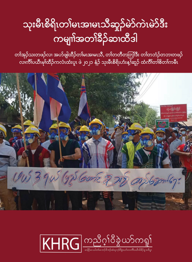
လံာ်တၢ်ဟံၣ်ဖျါအလၢအပူၤန့ၣ် တၢ်ရၢလီၤအီၤလၢအကလံးကျိၣ်ဒီးပယီၤကျိၣ်န့ၣ်လီၤ. လံာ်တၢ်ဟံၣ်ဖျါလၢကျိၣ်သၢမၤလၢာ်အံၤ တၢ်ဟံးန့ၣ်အီၤသုလၢ ကညီဂွံဝိခွဲယာ်ကရူာ် တၢ်ကစီၣ်သန့ဝဲ www.khrgh.org အပူၤသ့ၣ်န့ၣ်လီၤ.

စးထီၣ်လၢ ကီၢ်ပယီၤသုးဟံးန့ၣ်ဆူၣ်ထံးကီၢ်တၢ်စိတၢ်ကမိၤ ၆ လၢ ဖျါတြၢ်အါရံၤ ၁ သီ, ၂၀၂၁ နံၣ်လံၤလံၤန့ၣ် ကီၢ်ပယီၤပုၤ ပုၤဟီၣ်ခိၣ်ဖိခွဲယာ်အတၢ်အိၣ်သးဟံးန့ၣ်ထီၣ်ဝဲန့ၣ်လီၤ. ကီၢ်ပယီၤသုးကီၢ်ကးကရၢ (စကစ) လၢအဘၣ်တၢ်တီခိၣ်ရိၣ်မဲအီၤလၢ သုးရိၣ်မဲခိၣ်ကျါ မ့အီၤလဲၤအံၤ အိၣ်ဒီးတၢ်ရဲၣ်တၢ်ကျဲၤလီၤတၢ် လီၤဆဲးလၢ အသုးတၢ်စုဆူၣ်ခိၣ်တကး မၤတပျုၣ်တပျီၤ, မၤဘၣ်ဒိဘၣ်ထံးဝဲ ထံးကီၢ်ဖိတဖၣ်ဒီး မၤလီၤမံာ်ကွံာ်ဝဲ ကမုၢ်ဒီးထံးကီၢ်သးအတၢ်ဒိသဒၢတနီၤ လၢအိၣ်ကွဲးဟံးအသးဝဲ ၂၀၀၈ တၢ်ဘျါခိၣ်သ့ၣ်အပူၤ အိၣ်ကွဲးလီၤအသး လၢကဒိသဒၢတဖၣ်န့ၣ်လီၤ. အါန့ၣ်အန့ၣ် (စကစ) သုးမိၤစိရိၤတဖၣ်အံၤ အိၣ်ထီၣ်ကျဲၤဒ်သးတၢ်မၤပယုၤပုၤဟီၣ်ခိၣ်ဖိခွဲယာ်တဖၣ် ကကထီၣ်သးအါထီၣ်ဝဲအဂီၢ်န့ၣ်လီၤ. ဝဲသုးမိၤစိရိၤဟံးန့ၣ်ဆူၣ်ထံးကီၢ်တၢ်စိတၢ်ကမိၤ အခိၣ်ထံးယုလၢအတီၢ်ပူၤန့ၣ် အဝဲသ့ၣ်ဟံးထံးကီၢ်ဖိတဖၣ် ဒ်ထံးကီၢ်အဒုၣ်ဒါအသး ဒီးမၤဆူၣ်ထီၣ်အတၢ်ဂဲၤပျါဂဲၤဆုး ဒ်သးကဆိၣ်တၢ်မၤလီၤပွဲၤကွံာ်ဝဲ ပုၤလၢအထီဒါအဝဲသ့ၣ်တဖၣ်အယိ ဒုးအိၣ်ထီၣ်တၢ်စုဆူၣ်ခိၣ်တကး လၢထံးကီၢ်ဒိတဘျီအပူၤ ဒီးသးသမုၢ်အါဖျါ ဘၣ်လီၤမံာ်ကွံာ်ဝဲဒ်န့ၣ်လီၤ. (စကစ)သုးမိၤစိရိၤတဖၣ်အံၤ ခးဒီးမၤသံဝဲ ပုၤလၢအဟံၣ်ဖျါထီၣ်တၢ်ဘၣ်သးထီဒါသုးမိၤစိရိၤလၢတၢ်မုၢ်တၢ်စုဆူၣ်အပူၤ ဒီးသုးမိၤစိရိၤကဘိယုၤခးလီၤကျိဖးဒိၣ်ဆူၣ်သဝီတဖၣ်အပူၤအယိ လီၤကဝီၤသဝီဖိလၢအကထီတဖၣ် ဘၣ်ယုၤမံာ်ဖျါဒ်န့ၣ်လီၤ. တကးဒီးဘၣ် အဝဲသ့ၣ်တြၢ်မၤတံာ်တံာ်ထံးကီၢ်ဖိတဖၣ်ဒ်သးအသုတဒီးန့ၣ်ဘၣ် ဆူၣ်ချုတၢ်အံးထွဲကွံာ်ထွဲဒီးတၢ်ကစီၣ်တဖၣ်, သုးထံးကီၢ်တၢ်သိၣ်တၢ်သီတဖၣ် ဒီးဖိၣ်ဒုးယာ်ဝဲ, မၤဆုးမၤဆါဝဲ ထံးကီၢ်ဖိတဖၣ် ဒီးဟံးန့ၣ်ဝဲအရၢဒ်အတၢ်ဘၣ်သးဒ်ဝဲအသးန့ၣ်လီၤ.