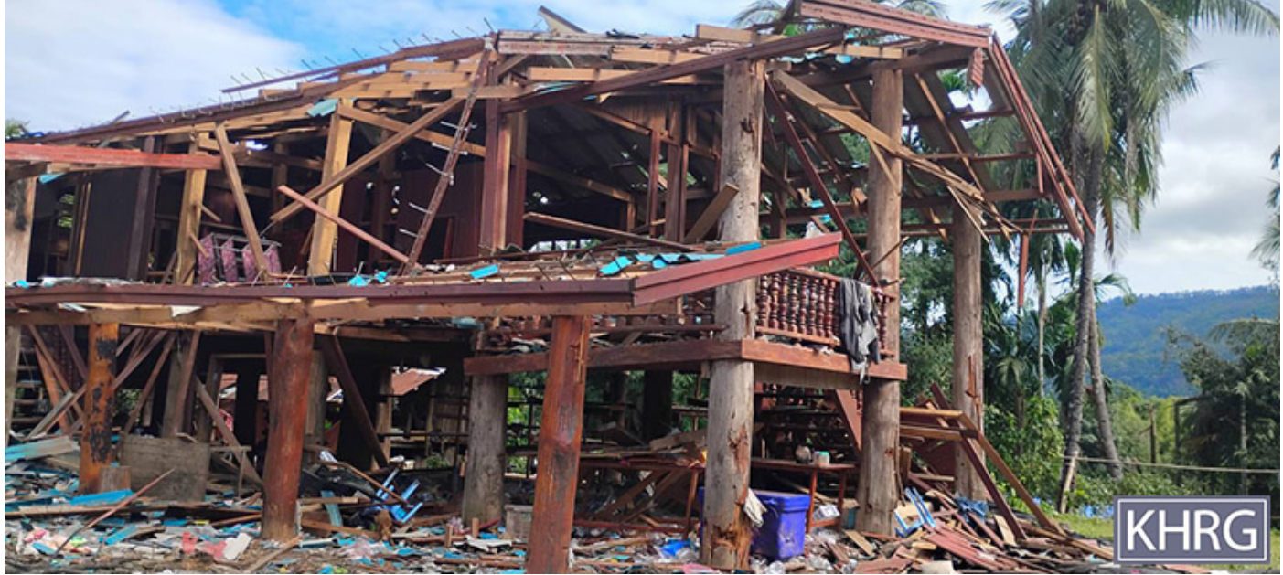
ဤဓာတ်ပုံကို ၂၀၂၅ ခုနှစ်၊ နိုဝင်ဘာလအတွင်း ဒူးပလာယာခရိုင်၊ စုကလိကျေးရွာအုပ်စု၊ ခခ--- ကျေးရွာတွင် KHRG ကွင်းဆင်းလုပ်သားတစ်ဦးက ရိုက်ယူခဲ့သည်။ ပုံတွင် ၂၀၂၅ ခုနှစ်၊ နိုဝင်ဘာလ ၂၀ ရက်နေ့၌ မြန်မာစစ်တပ်ပိုင်ဂျက်လေယာဉ်တစ်စီးသည် ခခ--- ကျေးရွာတွင် လာရောက်ဗုံးကြဲ၍ ရွာသားတစ်ဦး၏နေအိမ်ထိမှန်သဖြင့် ပြိုကျပျက်စီးသွား သောအခြေအနေကို ဖော်ပြထားသည်။

ဥပမာဖြစ်စဉ်တစ်ခုမှာ ၂၀၂၅ ခုနှစ်၊ နိုဝင်ဘာလ ၂၀ ရက်နေ့တွင် မြန်မာ စစ်တပ်ပိုင်ဂျက်လေယာဉ်တစ်စီးသည် ကော်တရီမြို့နယ်၊ စုကလိ ကျေးရွာအုပ်စု၊ ခခ--- ကျေးရွာကို ပေါင် (၅၀၀) ဗုံးသုံးလုံးပစ်ချတိုက် ခိုက်ခဲ့၍ စာသင်ကျောင်း (၁) ကျောင်း၊ ဘုန်းကြီးကျောင်း (၁) ကျောင်း၊ လူနေအိမ် (၆)လုံးအနည်းငယ်ထိမှန်ပျက်စီးသွားပြီး အခြားလူနေအိမ် (၃) လုံးအား ထိမှန်၍ပြိုကျပျက်စီးသွားခဲ့သည်။ ထို့အပြင် ရွာသား (၁) ဦးသေဆုံးပြီး (၁) ဦးထိ မှန်ဒဏ်ရာရရှိခဲ့သည်။ ဒဏ်ရာရရှိသည့်ရွာသား တစ်ဦးကို ထိုင်းနိုင်ငံရှိ ခစ--- ဆေးရုံသို့ပို့ဆောင်ခဲ့သည်။ မြန်မာစစ် တပ်ပိုင်ဂျက်လေယာဉ်တစ်စီးသည် ထိုကျေးရွာကို ဗုံးကြဲတိုက်ခိုက် သည့်အချိန်တွင် ၎င်းတို့၏ Y-12 လေ ယာဉ်တစ်စီးသည်လည်း (၁၂၀) မမ လက်နက်ကြီးကျည်သီးများ အလုံး (၂၀) ကျော် ပစ်ချခဲ့သေးသည်။