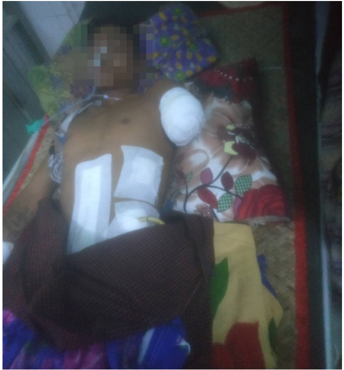
ဤဓာတ်ပုံအား ထိခိုက်ဒဏ်ရာရရှိသူ၏ ဖခင်ဖြစ်သူထံမှ ၂၀၂၆ ခုနှစ်၊ ဒီဇင်ဘာလ ၈ ရက်နေ့တွင် ရရှိခဲ့ခြင်းဖြစ်သည်။ ဤဓာတ်ပုံသည် ကခ--- ပြည်သူဆေးရုံတွင် ဆေးကုသမှုခံယူနေသည့် မောင်က--- ၏ပုံဖြစ်သည်။

မြန်မာစစ်သားများနှင့်အတူ ၎င်းတို့ဖမ်းဆီးခိုင်းစေခြင်းခံရသည့် ဒေသခံတစ်ချို့ ထိခိုက်ဒဏ်ရာရရှိ၍ တစ်ချို့သေဆုံးခဲ့သည်။ ထိခိုက်ဒဏ်ရာရရှိသည့် ရွာသားများထဲတွင် မောင်က--- သည် ဝမ်းဗိုက်နံဘေးနှင့် လက်မောင်းတွင် ဒဏ်ရာရရှိခဲ့သည်။ မောင်က--- ထိခိုက်ဒဏ်ရာရရှိပြီးနောက် မြန်မာစစ်သားများသည် ၎င်းအား ကခ--- တပ်စခန်းရှိ ဆေးရုံသို့ ဆေးကုသမှုခံယူစေရန် ပို့ဆောင်ပေးခဲ့သည်။ ၂၀၂၅ ခုနှစ်၊ စက်တင်ဘာလ ၇ ရက်နေ့ နံနက်စောစောတွင် မောင်က--- ၏မိသားစုများသည် ၎င်း၏သတင်းကို ကြားသိကြပြီးနောက် မောင်က--- ၏နောက်သို့ လိုက်သွားကြသည်။ ၎င်း၏မိသားစုဝင်များ မြို့ပေါ်သို့ရောက်ရှိချိန်တွင် မောင်က--- အား ကခ--- မြို့ပေါ်ရှိ ပြည့်သူဆေးရုံသို့ လွှဲပြောင်းပို့ ဆောင်ထားကြောင်း သိရှိခဲ့ကြသည်။ မောင်က--- ၏လက်တွင် ဒဏ်ရာရရှိထားသောကြောင့် ဆရာဝန်များမှ ၎င်း၏လက်အား ဖြတ်ထုတ်ပေးခဲ့ရသည်။ ၎င်းအနေဖြင့် ဆေးရုံတွင် ဆေးကုသမှုတစ်လကျော်ခံယူခဲ့ရပြီး ၂၀၂၅ ခုနှစ်၊ ဒီဇင်ဘာလ ၇ ရက်နေ့တွင် ဆေးရုံဆင်းခဲ့သည်။