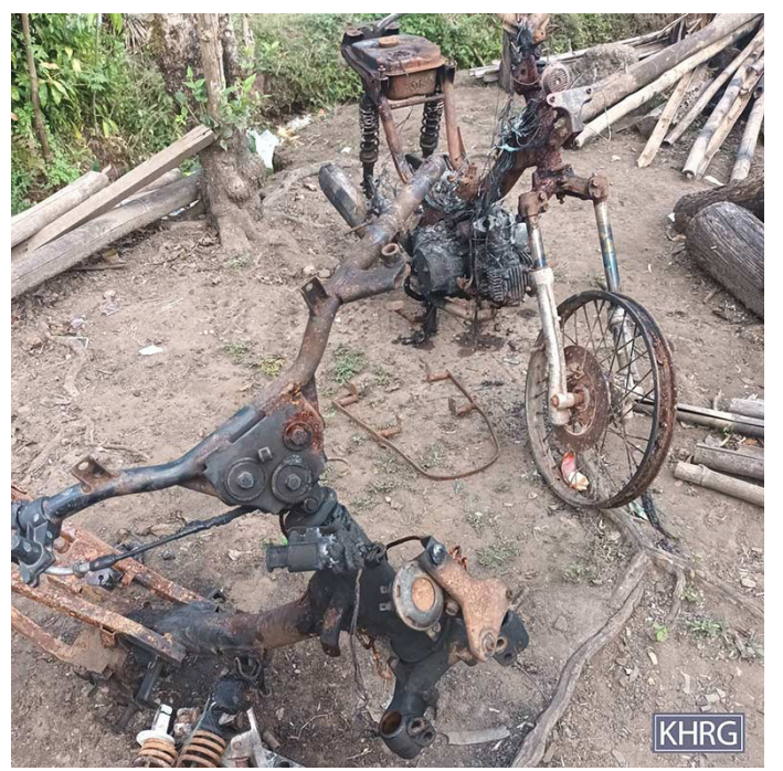
ဤဓာတ်ပုံအား ၂၀၂၅ ခုနှစ်၊ ဒီဇင်ဘာလ ၈ ရက်နေ့တွင် ဒူးပလာယာခရိုင်၊ ဝေါရေမြို့ နယ်၊ ကရေထကျေးရွာ အုပ်စု ကက--- ကျေး ရွာတွင် မှတ်တမ်းတင်ခဲ့သည်။ ပုံတွင် မြန်မာစစ်တပ်နှင့် PDF တပ်ဖွဲ့များ ကျေးရွာအတွင်းပစ်ခတ်တိုက်ခိုက်ကြသောကြောင့် မီးလောင်ကျွမ်းသွားသော စောစ --- ၏ ဆိုင်ကယ်ပြင်ဆိုင်နှင့် ဆိုင်ကယ်နှစ်စီး၏ ပုံ အားဖော်ပြထားခြင်းဖြစ်သည်။

၂၀၂၅ ခုနှစ်၊ နိုဝင်ဘာလ ၁၅ ရက်နေ့ နံနက် ၉ နာရီတွင် မြန်မာစစ်တပ် ခြေလျင်တပ်ရင်း (ခလရ - ၅၉၁) မှ တပ်သားများသည် ဒူးပလာယာ ခရိုင်၊ ဝေါရေမြို့နယ်၊ ကရေထကျေးရွာအုပ်စု၊ ကက--- ကျေးရွာ အတွင်းသို့ ဝင်ရောက်ခဲ့သည်။ မြန်မာစစ်သားများသည် ကျေးရွာသူကြီး