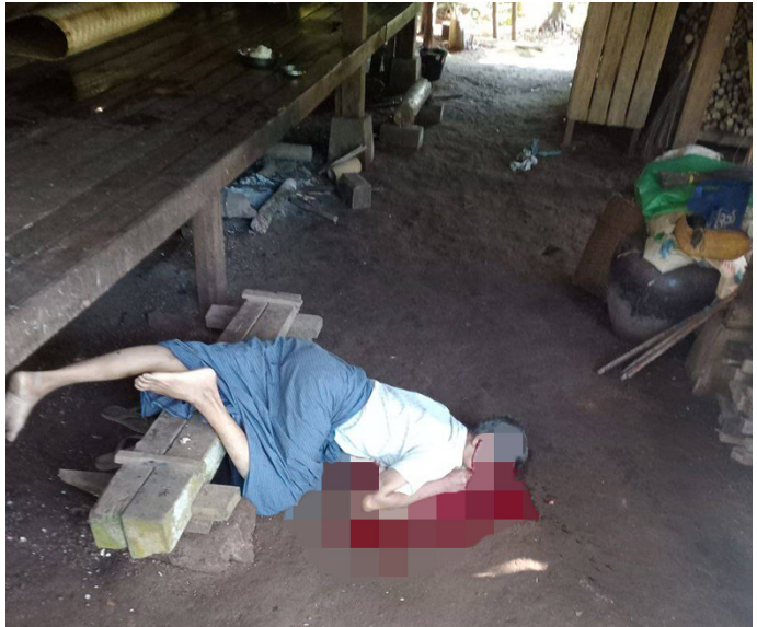
၂၀၂၅ ခုနှစ်၊ ဒီဇင်ဘာလ ၂၄ ရက်နေ့ ဗွန်းလွဲ (၂) နာရီခန့်တွင် KNU ၏ ထိန်းချုပ်နယ်မြေ ဖြစ်သော ဒူးသထူး(သထုံ)ခရိုင်၊ ကျိုက်ထိုမြို့နယ် သံတံတားဂိတ်ရှိ စကမ-SSPC သည် လက်နက်ကြီး (၁၂၀ မမ) ဖြင့် တိုက်ပွဲဖြစ်ပွားခြင်းမရှိပဲ ပစ်ခတ်ခဲ့သောကြောင့် ဒူးသထူး (သထုံ) ခရိုင်၊ ကျိုက်ထိုမြို့နယ်၊ အလူးကျေးနယ်အုပ်စု၊ ဂယ--- ကျေးရွာမှ သေဆုံးသွား သော ရွာသား (၂) ဦးအနက် တစ်ဦးဖြစ်သည့် အသက် (၅၈) နှစ်အရွယ် ဦးအဟ--- ၏ ပုံဖြစ်သည်။

ထိုနည်းတူ ၂၀၂၅ ခုနှစ်၊ ဒီဇင်ဘာလ ၂၄ ရက်နေ့ နံနက် (၁၀:၀၄) ခန့် တွင် (တပ်မ-၄၄) လက်အောက်ခံ ဘီးလင်းမြို့အခြေစိုက် (ခမရ-၃) တပ်ရင်းမှ ဟော်ဝေဇာဖြင့် လက်နက်ကြီး ဗုံးသီး (၂)လုံးပစ်ခတ်ရာ ကေ အန်ယူ ကျိုက်ထိုမြို့နယ် အလူးကျေးနယ်၊ ဒေ---ရွာအနီးရှိ ဂဝ--- ဘုန်းတော်ကြီးကျောင်း၌ ကျရောက်ပေါက်ကွဲခဲ့သောကြောင့် ရွာသား (၃)ဦး ထိမှန်သေဆုံးခဲ့ပြီး (၂)ဦး ထိခိုက်ဒဏ်ရာရှိခဲ့သည်။ နော်အလ--- (အသက်-၂၃ နှစ်)သည် တက္ကသိုလ်နောက်ဆုံးနှစ်ကျောင်းသူဖြစ်ပြီး၊ သူမ၏မိခင်ဖြစ်သူနှင့်အတူ ဘုန်းကြီးကျောင်းသို့အဖော်လိုက်ပေးစဉ် လက်နက်ကြီးကျောက်ကွဲရာ ကျည်စသည်သူမ၏ဦးခေါင်းအားထိမှန် ခဲ့သောကြောင့် နေရာမှာပင် ပွဲချင်းပြီး သေဆုံးခဲ့ရသည်။ ထိုနည်းတူ ကျည်စသည် နော်အရ--- (အသက်-၃၀ နှစ်)၏ ဦးခေါင်းနှင့် နော် အယ--- (အသက်-၄၉ နှစ်)၏ ရင်ဘတ်တို့ကိုလည်းထိမှန်ပြီး သူမ ၏ရင်ဘတ်ပွင့်ထွက်သွားကာ နေရာတွင်ပင် သေဆုံးခဲ့ကြသည်။ ထို့ အပြင် ကျည်စသည် နော်အမ--- (အသက်-၃၆ နှစ်)၏ ခါးနှင့် ဝမ်းဗိုက် တို့ကို ထိမှန်ခဲ့သည်။ သူမ၏ဒဏ်ရာသည် ပြင်းထန်သောကြောင့် ဂသ--- ဆေးရုံသို့ အရေးပေါ်ပို့ဆောင်ခဲ့သည်။ ဦးအဘ--- (အသက်-၃၅ နှစ်)မှာ မူ ဘယ်ဖက်လက်မောင်းအား ကျည်စထိမှန်ခဲ့ပြီး မစိုးရိမ်ရပေ။