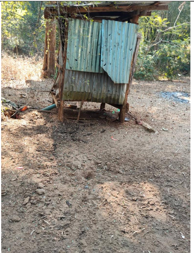
ဖဲလါဖျါတြုၤအါရံၤ ၃ သီ, ၂၀၂၆ နံၣ်အနံၤကဘၣ်ဖဲဂီၤခီ ၁၀ န့ၣ်ရံၣ်အဆၢကတီၢ် ကျိးဒိၣ် ၆၀ မမ အချံလၢဘၣ်တၢ်န့ၣ်အီၤလၢ ပယီၤသုးခးလီၤဝဲခံဖျါၣ် လီၤတၢ်ပိာ်ဖးထီၣ်ဖဲ အဆ--- သဝီ, ပရီၤလိာ်ကရူၢ်, ဒိၣ်ဖါခိၣ်ကီၢ်ဆၢ, တီအူကီၢ်ရ့ၣ်အပူၤန့ၣ်လီၤ. တၢ်ဂီၤလၢအစုၣ် တဘုၣ်အံၤဟံးဖျါထီၣ်ဝဲသဝီဖိတဂၤလၢ အမံၤမ့ၢ် နီၢ်ဘ---, လၢအသးနံၣ်အိၣ် ၃၈ နံၣ်, ဘၣ်ဝဲဒီးကျိးဒိၣ်ချံအကျါတဖျါၣ်အက့