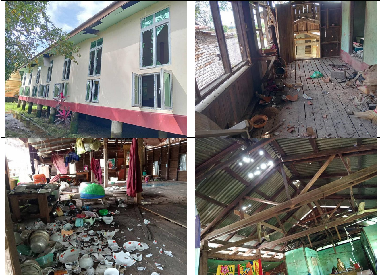
တၢ်ဂီၤခဲဘျုးအံၤ တၢ်ဒီးန့ၢ်ဘၣ်အီၤလၢလီၢ်ကဝီၤပုၤဘၣ်မူဘၣ်ဒါအအိန် ဖဲလါစဲးပထုဘၣ် ၂၆ သီ, ၂၀၂၅ နံၣ်န့ၣ်လီၤ. တၢ်ဂီၤသ့ၣ်တဖှ်အံၤဟ်ဖျါထီၣ်ဝဲ ဖဲ လါစဲးပထုဘၣ် ၂၆ သီ, ၂၀၂၅ နံၣ်အနံၤ မုာ်ထူၣ် ၁၂:၀၀ နံၣ်ရံၣ်အဆၢကတီၢ် ကီၢ်ပယီၤသုးမိၤစိရိၤအကဘီယုၤဟဲတ့ၢ်လီၤမ့ၢ်ပိာ်လီၤတော်လၢသီခါဖျါက ရုာ်ပူၤဖဲ ကက--- သဝီ, ပူၤယုၤကရုာ်, ဆိထံးကီၢ်ဆၢ, ချါၣ်လွံာ်ထူၣ်ကီၢ်ရဲၣ်ပူၤအဃိ ဘၣ်ဟးဂီၤဝဲသီခါဖျါတၢ်သ့ၣ်ထီၣ် ဒီး တၢ်ပီးတၢ်လီၤလၢအအိန်

ဖဲလါစဲးပထုဘၣ် ၂၆ သီ, ၂၀၂၅ နံၣ်အနံၤန့ၣ် မ့ၢ်လၢတၢ်ဒုးကဲထီၣ်လၢ ကီၢ်ပယီၤသုးမိၤစိရိၤ ဒီး KNLA သုးပာ်ဖိၣ်သ့ၣ်တဖှ် အဘၣ်စၢၤဖဲ ကက--- သဝီ, ပူၤယုၤကရုာ်ပူၤ ဒီး မ့ၢ်လၢကီၢ်ပယီၤသုးမိၤစိရိၤအပုၤဘၣ်ဒိအါအဃိ လၢတၢ်ဟဲဒုးစၢၤအပုၤအဂီၢ် ဖဲမုာ် ထူၣ် ၁၂:၀၀ နံၣ်ရံၣ်အဆၢကတီၢ်န့ၣ် ကီၢ်ပယီၤသုးမိၤစိရိၤအကဘီယုၤ Y-12 ဟဲတ့ၢ်လီၤမ့ၢ်ပိာ် (၆) ဖျါ ဖဲပူၤယုၤကရုာ် ဟိန်ကဝီၤပူၤ တၢ်ဒုးကဲထီၣ်အလီၢ်န့ၣ်လီၤ. မ့ၢ်ပိာ်အကျါ (၂) ဖျါန့ၣ်လီၤတော်လၢသီခါဖျါကရုာ်ပူၤ ဖဲ ကက--- သဝီ, ပူၤယုၤကရုာ်ပူၤဒီး ဘၣ်ဒိဟးဂီၤဝဲသီခါဖျါ အိန်ဒုး, အဒုၣ် ဒီး တၢ်ပီးတၢ်လီၤလၢအအိန်ဖဲသီခါဖျါအပူၤသ့ၣ်တဖှ်န့ၣ်လီၤ.