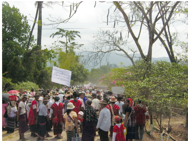
အထက်ပါပုံကို ၂၀၁၂ခုနှစ် မေလ ၉ ရက်နေ့တွင်ရိုက်ယူခဲ့သည်။ ကျောက်ကြီးမြို့၌ ဆက်ဆံရေးရုံးဖွင့်လှစ်ရန် ဖွင့်ပွဲအခမ်းအနားသို့ တက်ရောက်လာကြမည့် KNU ခေါင်းဆောင်များနှင့် မြန်မာအစိုးရအရာရှိများကို စောင့်ဆိုင်း နေကြသည့် ရွာသူရွာသားများကို ကရင်တိုင်းရင်းသားဝတ်စုံဖြင့် မြင်ရခြင်းသည်။

၂၀၁၁ ခုနှစ်မှစ၍ မြန်မာအစိုးရသည် ဖြေလျော့မှုနှင့် ဆိုင်သည့် လုပ်ဆောင်မှုများအား အလျင်အမြန်ဆောင်ရွက်ခဲ့ပါသည်။ ငြိမ်းချမ်းစွာ ဆွေးနွေးခြင်း၊ စုရုံးခြင်း များအား ပိုမို အခွင့်ပေးမှု ပါဝင်သော ဥပဒေသစ်များ၊ အလုပ်သမားအခွင့်အရေး နှင့် နိုင်ငံရေးတွင် ပိုမို ကျယ်ပြန့်စွာ ပူးပေါင်းပါဝင်နိုင်ရေး များကို မြှင့်တင်ပေးခြင်း နှင့်ဆိုင်သည့် ဥပဒေသစ်များ ပြဌာန်းအတည်ပြုပေးခဲ့ပြီး တိုင်းရင်းသားလူမျိုးများ နေထိုင်ရာကျေးလက်ဒေသများရှိ လူ့အခွင့်အရေးဆိုင်ရာ ပြဿနာများကို ဖြေရှင်းရန် နိုင်ငံတကာကိုယ်စားလှယ်များနှင့် လုပ်ငန်းသဘောတူညီမှုများ လုပ်ဆောင်ခဲ့ပါသည်။ ယင်းကာလအတွင်း အစိုးရအနေဖြင့် နိုင်ငံတစ်ဝန်းလုံးမှ တိုင်းရင်းသားလက်နက်ကိုင်အုပ်စုများ (EAGs)နှင့် အပစ်အခတ်ရပ်စဲရေးကို ဆက်လက်လုပ်ဆောင်ခဲ့သည်။ ကရင်လက်နက်ကိုင်အုပ်စုများ (Karen EAGs) နှင့် လက်မှတ်ရေးထိုးခဲ့သော အပစ်အခတ် ရပ်စဲရေး သဘောတူညီချက်များ က မြန်မာနိုင်ငံအရှေ့တောင်ဘက်ရှိ လုံခြုံရေးအခြေအနေကို အပြောင်းအလဲဖြစ်စေခဲ့ပါသည်။ အစိုးရအနေဖြင့် လူ့အခွင့်အရေးဆိုင်ရာ ပြဿနာစိန်ခေါ်မှုများနှင့် ပတ်သက်၍ လွတ်လပ်စွာ ပြောဆိုခွင့်များ ဖွင့်ထားပေးပြီး မြန်မာပြည် အရှေ့တောင်ပိုင်းသို့ နိုင်ငံရပ်ခြားမှ အကူအညီပေးသူသစ်များ အများအပြား ဝင်ရောက်လာကြသည်။ ထိုအခါ ဒေသခံများနှင့် နိုင်ငံတကာမှ မြန်မာပြည်အရေး ဆောင်ရွက်သူများကြား ဒေသတွင်း