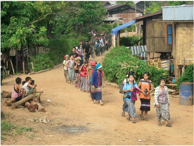
အထက်ပါတတ်ပုံများမှာ ၂၀၁၂ခုနှစ် မေလ ၁၄ ရက်နေ့တွင် တောင်ငူခရိုင်၌ KNU က လုပ်ဆောင်ခဲ့သည့် အပစ်အခတ် ရပ်စဲရေးကိစ္စ ဆွေးနွေးပွဲပုံများဖြစ်သည်။ ဝဲဘက်ပုံတွင် ဗဟို KNU ခေါင်းဆောင်တစ်ဦးနှင့် နယ်မြေခံ KNLA ညွှန်ကြားရေးအရာရှိ တစ်ဦးတို့ တောင်ငူခရိုင် ကလေးဆောခီးရွာ၏ ခေါင်းဆောင်များနှင့် တွေ့ဆုံပြီး အပစ်အခတ် ရပ်စဲရေးအကြောင်း ဆွေးနွေးနေပုံကို မြင်ရမည်ဖြစ်သည်။ ထိုအစည်းအဝေးတွင် ကျေးရွာခေါင်းဆောင်များကမူ အပစ်အခတ်ရပ်စဲရေး လုပ်ငန်းစဉ်ကို သဘောတူသော်လည်း ၎င်းတို့နယ်မြေအတွင်းရှိ မြန်မာစစ်တပ်စခန်းများကို ဖျက်သိမ်းပြီး တပ်များပြန်ဆုတ်သွားရန် လိုလားသည်ဟု တင်ပြခဲ့ကြသည်။ စစ်တပ်က ရိက္ခာနှင့်စစ်သားများဖိုမိုစေလွှတ်ခြင်းနှင့် ပတ်သက်၍ ရွာသူရွာသားများက အထူးပင် စိတ်ပူနေကြသည်။ ယာဘက်မှပုံမှာ ရွာသားများနှင့် KNUအဖွဲ့ဝင်များ အပစ်အခတ်ရပ်စဲရေး ကိစ္စဆွေးနွေးရေး တွေ့ဆုံပွဲတစ်ခုအား တောင်ငူခရိုင် ကော်သေးဒိရွာ၌ တက်ရောက်ရန် စုဝေး ရောက်ရှိလာပုံဖြစ်သည်။