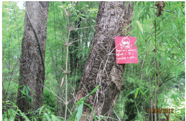
အထက် ဖော်ပြပါဓာတ်ပုံသည် ၂၀၁၂ခုနှစ် မေလ ၁၇ ရက်နေ့ ကော့ကရိတ်မြို့နယ်၊ ဇူးပလာယာခရိုင်တွင် ရိုက်ကူးထား ခြင်းဖြစ်သည်။ ထိုသစ်ပင်နှစ်ပင်အောက်တွင် မိုင်းရှိသည်ဆိုသည်ကို မြန်မာ၊ ကရင်၊ အင်္ဂလိပ်ဘာသာ ဖြင့် ပြထားခြင်းဖြစ်ပါသည်။ ထိုမိုင်းသည် DKBA မှထောင်ထားခြင်းဖြစ်ပြီးယခင်က မြန်မာစစ်တပ် စစ်ချီရာတွင် ထိုသစ်ပင်အောက်၌အနားယူလေ့ရှိသောကြောင့်ဖြစ်သည်။ ၎င်းတို့၏ သားသမီးများက ကျွဲနွားများကို ထိုနေရာတစ်ဝိုက်တွင် လွှတ်ကျောင်းလေ့ရှိသောကြောင့် ထိုအနီးအနားရှိ လယ်ပိုင်ရှင်များက အဆိုပါ မိုင်းနှင့် ပတ်သက်ပြီး စိုးရိမ်ပူပန်နေကြသည်။

ရွာသားများ၏ လှုပ်ရှားသွားလာမှုနှင့် အသက်မွေးဝမ်းကျောင်း ပြုမှုကို အလွန်အမင်း ကန့်သတ်ထားခြင်းဖြစ်ပြီး ရောက်စေသည်။ တပ်မတော်နှင့် EAGအဖွဲ့များအနေဖြင့် မိုင်းရှင်းလင်းခြင်းကို စတင်လုပ်ဆောင်ခဲ့သော်လည်း မတော်တဆထိခိုက်မိခြင်း၊ နည်းပညာကျွမ်းကျင်မှု အားနည်းခြင်းနှင့် ပူးပေါင်းဆောင်ရွက်မှုဆိုင်ရာ ပြဿနာများကြောင့် ယင်းသို့သော ကြိုးပမ်းအားထုတ်မှုများကို အချိန်မတိုင်ခင် အဆုံး သတ်ခဲ့ရပါသည်။ ရွာသားများအနေဖြင့် စစ်သားများက မိုင်းများကို ရှင်းလင်းဖယ်ရှားပေးရန် တောင်းဆိုခြင်း၊ အခြား သောလမ်းကြောင်းများကို ရွေးချယ်အသုံးပြုခြင်းနှင့် မြေမြှုပ်မိုင်းများ၏ တည်နေရာကို မှတ်သားရန် လက်နက်ကိုင်အုပ်စုများနှင့် အတူလုပ်ဆောင်ခြင်းကဲ့သို့သော ကာကွယ်ရေးလုပ်ငန်းစဉ်များ ပေါ်ပေါက်လာစေရန် ဆက်လက်ဆောင်ရွက်ကြပါသည်။