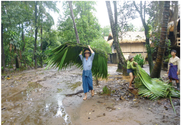
ဤဓာတ်ပုံသည် ၂၀၁၂ ခုနှစ် သထုံခရိုင်၊ ဘီးလင်းမြို့နယ်၊ လေးခေးကျေးရွာမှ ရွာသားများကို လေးခေး စစ်စခန်းမှ တပ်မတော် LIB # 207က ခန့် မိုးများ ပြုလုပ်၍ ပို့ဆောင်ခိုင်းပုံဖြစ်သည်။