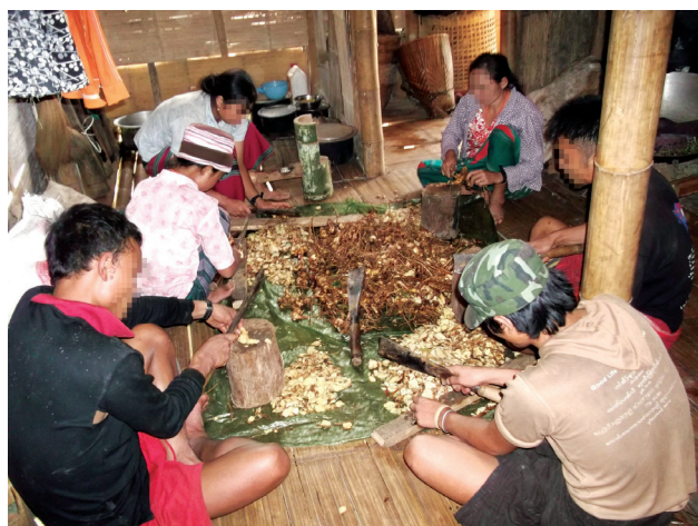
အထက်ပါပုံကို KNU ထိန်းချုပ်ရာ နယ်မြေတစ်ခုရှိ ဖာပွန်ခရိုင်၊ လူသောမြို့နယ်၊ ဆေးပု ကျေးရွာအုပ်စုတွင် ရိုက်ယူခဲ့ပြီး တယူပယ်ခို နှင့် တစီးထ ရွာတွင် KHRG သတင်းကောက်ယူသူတစ်ဦးက ၂၀၁၂ ခုနှစ်၊ အောက်တိုဘာလတွင် ရိုက်ကူးခဲ့သည်။ ၎င်းပုံတွင် ပါရှိသည့် "လူသောဖောအေး သေဂီဝါဆဲ"အဖွဲ့ ကို "တိုင်းရင်းဆေးအဖွဲ့" ဟုသာသာပြန်ဆိုသည်။ ၎င်းအဖွဲ့တွင် အဖွဲ့ဝင် (၂၄) ဦးနှင့် ကော်မတီဝင်(၉) ဦးပါဝင်ပြီး တိုင်းရင်းဆေးဝါး (၁၀) မျိုးကို ဖော်စပ်ထုတ်လုပ်ပါသည်။ အဆိုပါ အဖွဲ့ဝင်များအဆိုအရ ၎င်းတို့ထုတ်လုပ်နေသည့် ဆေးဝါးပုံစံ အမျိုးအစားများကို တိုးတတ်ကောင်းမွန် လာစေရန်အတွက် ကျွမ်းကျင်သူ ပညာရှင်များကို ၎င်းတို့နှင့်အတူ ပူးပေါင်းလုပ်ဆောင်လို သည်ဟု ဆိုပါသည်။