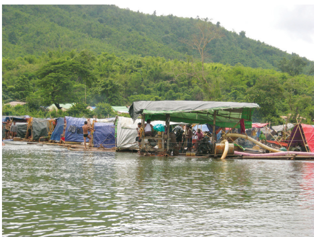
ဤပုံကို ၂၀၁၂ ခုနှစ် ဇူလိုင်လ ၁၅ ရက်နေ့တွင် ရိုက်ယူခဲ့ပြီး ညောင်လေးပင်ခရိုင် ရွှေကျင်ဆည်အောက်တွင် ရွှေလုပ်သားများ ရွှေတူးနေပုံဖြစ်သည်။ ရွှေတူးသားများသည် အထက်ပါပုံအတိုင်း ရွက်ထည်တံ တစ်ခုစီမူနေ၍ ရွှေတူးကြသည်။ ဤပုံကိုရိုက်ခဲ့သည့် KHRG သုတေသနပြုသူ၏ အဆိုအရ ရွှေလုပ်သားများသည် တပ်မတော် မြေမြှန်တပ်ရင်း အမှတ် ၅၇၂ သို့ တစ်လလျှင် ကျပ် ၈၀၀,၀၀၀ (အေီလာ ၈၀၀.၅၄) ပေးရသည်။