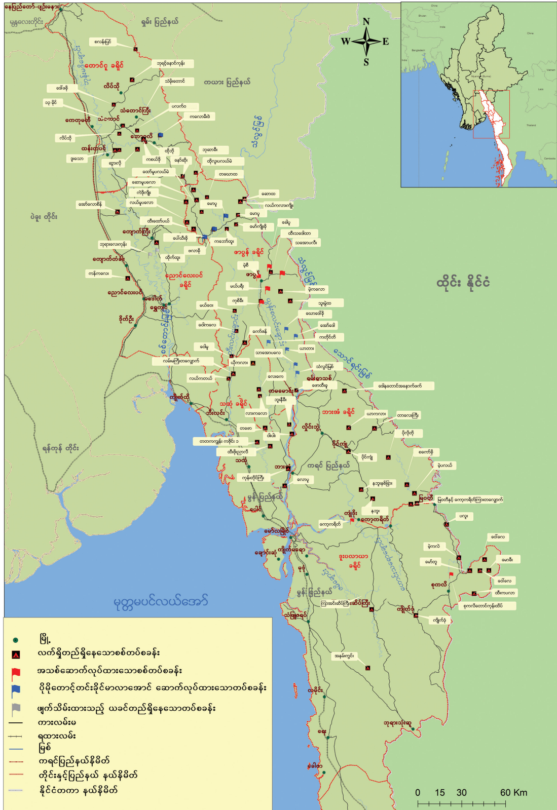
ကရင်လူ့အခွင့်အရေးအဖွဲ့

အထက်ပါမြေပုံသည် ၂၀၁၂ ဇန်နဝါရီ မှ ၂၀၁၃ နိုဝင်ဘာလ အတွင်း ကရင်လူ့အခွင့်အရေး အဖွဲ့သို့တင်ပြသော စစ်တပ်လုပ်ဆောင်ချက်များ သာ ထည့်သွင်းပါရှိပြီး၊ စစ်တပ် အခြေစိုက် စခန်းအားလုံး နှင့် ထိုကာလတွင်း တပ်ပိုင်း လှုပ်ရှားဆောင်ရွက်မှုပုံစံ များအားလုံး မပါဝင်ပါ။