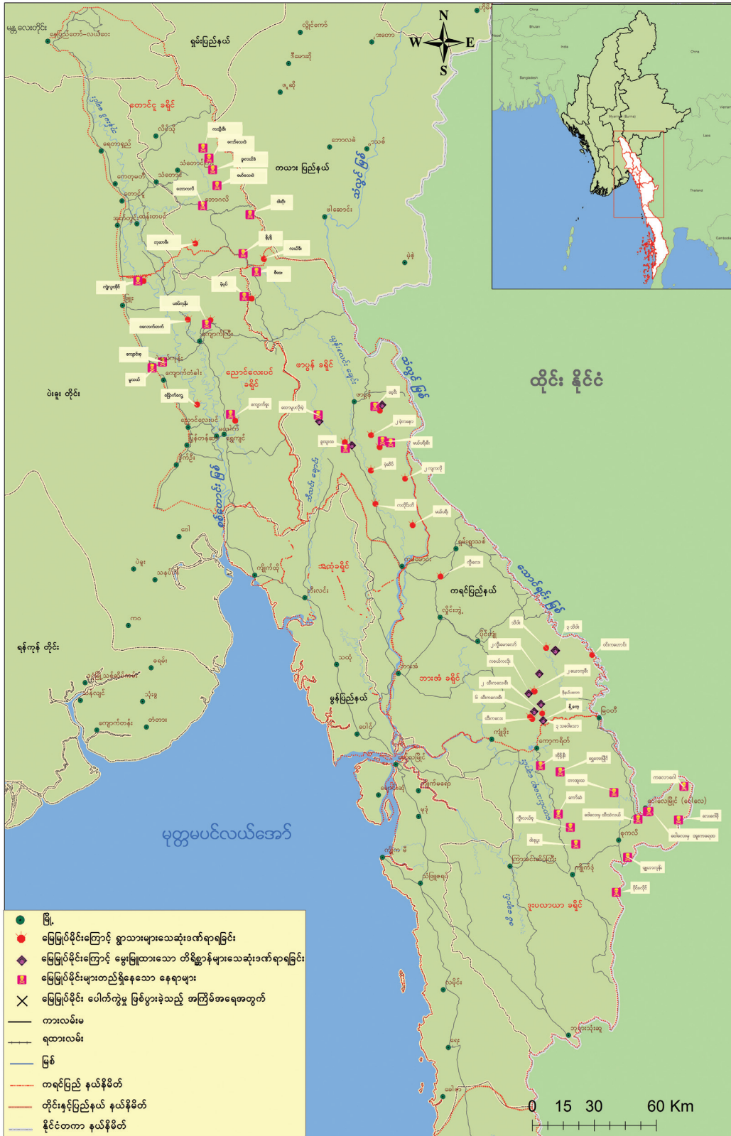
ကရင်လူ့အခွင့်အရေးအဖွဲ့

အထက်ပါမြေပုံသည် ၂၀၁၂ ဇန်နဝါရီမှ ၂၀၁၃ နိုဝင်ဘာ အတွင်း ကရင်လူ့အခွင့်အရေး သို့တင်ပြသောဖြစ်ရပ်များသာထည့်သွင်း ထားပြီး၊ မိုင်းများတည် ရှိသောနေရာဒေသအားလုံး (သို့) ထိုကာလအတွင်း ပေါက်ကွဲမှုဖြစ်ပွားသော ဖြစ်စဉ်တိုင်း မပါဝင်ပါ။