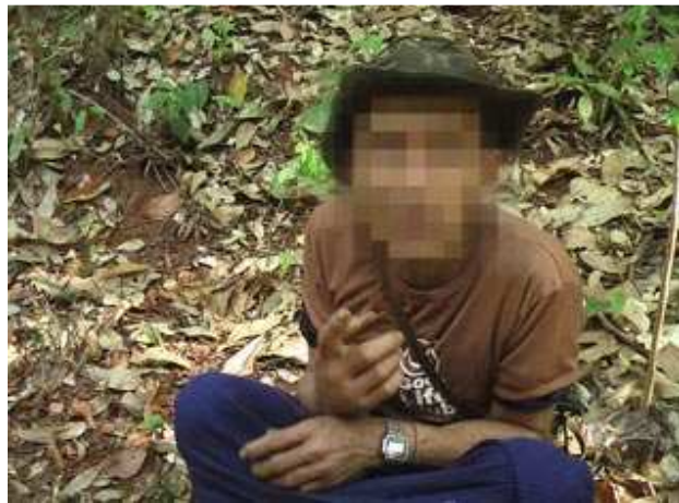
တၢ်ဂီၤတဘျီအံၤဘၣ်တၢ်ဒီးန့ၣ်အီၤဖဲလီၤဒ်ခဲဘၣ် (၂၁)သီ ၂၀၀၉နံၣ်နံၤဒီးဒုးန့ၣ်ဖျါထီၣ်ဝဲစီၤဂ... လၢအဘၣ်တၢ်ဖိၣ်အီၤလၢနအဖအသးလၢအအိၣ်လၢကီၢ်သ့ဒၢဖဲအဟးထီၣ်လၢအဟ... သဝီဒီး ထီတထူၣ်ကီၢ်ဆၢဒီးကလဲၤပူၤတၢ်အိၣ်ဖဲလီၤနီၣ်ဝဲဘၣ် ၂၀၀၉နံၣ်နံၤအပူၤန့ၣ်လီၤ. စီၤဂ...ဘၣ်တၢ် စၢဒီးတီၢ်အီၤဝဲဆၢဆူ ဖဲကီၢ် သ့ဒၢသုးကလၢဒီးမၤဆူၣ်အီၤလၢကဝဲတၢ် အိၣ်ဆူသုးကလၢအဂၤ တဖၣ်န့ၣ်လီၤ. အဝဲဒၣ် ဃုၢ် ဖျိးဖဲသုးကျိ လဲၤခီဘၣ်အ သဝီအခါဒီး နအဖအသးတဖၣ် ခးအီၤ ဖဲအယုၢ်အခါန့ၣ်လီၤ.

ခွၢ်အုၣ်အုၣ်ကွၢ်ပုၤထၢတၢ်ကစီၣ်ဟ်ဖျါဝဲလၢခမရ(၄၂၇)(တုၣ်မိၣ်ခွီၣ်တီခိၣ်ရီၤဝဲ)လၢအအိၣ်ဆီလီၤအသးဖဲကီၢ်သ့ဒၢတဖၣ်ဟူးဂဲၤဒံးဒ်တၢ် လၢဟီၣ်ကဝီၤအပူၤဒီးဖဲအထံၣ်သဝီဖိတဖၣ်လဲၤတၢ်လၢသဝီချၢအခါန့ၣ်ဖိၣ်ဝဲဒီးတဲာ်လၢအမၤတၢ်ဆဲးကျိးဒီးခွၢ်အဲၣ်ယုၣ်(မ့)ခွၢ်အဲၣ်အဲၣ်လၢ အုၣ်န့ၣ်လီၤ. ခွၢ်အုၣ်အုၣ်ကွၢ် အတၢ်ဟ်ဖျါလၢအပူၤကွၢ် ဟ်ဖျါဝဲလီၤတၢ်လီၤဆဲး ဘၣ်ပးဒီး တၢ်ဖိၣ်ပံးမၤပံးသဝီဖိ တဖၣ်အတၢ်ဟးထီၣ် က့ၤလီၤလၢနအဖအတၢ် ပၤ ဟီၣ်ကဝီၤ အပူၤ ဒ်အမ့ၢ်ကီၢ်သ့ဒၢသဝီဒီးကဲထီၣ်တၢ်လီၤဆဲးလီၤစ့ၤလၢ ထံဖိ ကီၢ်ဖိအတၢ်လုၢ် အိၣ်သးသမူအကျဲတဖၣ်န့ၣ်လီၤ. တီ အူသဝီ ဖိတဖၣ် ထီၣ်တီ ထံၣ်လီၤအသးလၢကြး မၤတၢ်လၢအ နီၢ်ခိအတၢ်ဘၣ် တၢ်ဘၢ အဂီၢ်လၢတၢ် လုၢ်အိၣ်သးသမူအတၢ် ဖဲးတၢ်မၤတဖၣ်အပူၤ န့ၣ်လီၤ. 17 ဖဲလၢအုၣ်ထီၣ်(၂) သီ ၂၀၁၀နံၣ်နံၤ ခမရ(၄၂၇) ဟူးဂဲၤ ကီၢ် သ့ဒၢသဝီချၢအခါ ဖိၣ် ဝဲစီမုန့ၣ်(အခၢ်ထီသ့)လၢ အမ့ၢ်သဝီဖဲဖဲန့ၣ်ဖဲ အလဲၤကျိ သ့ၣ်မ့ၢ်အဆၢကတီၢ်န့ၣ်လီၤ. ဒ်အမ့ၢ်ဂီၢ်နီၢ်ထီခိၣ်စဲးဘၣ်ခွၢ် အုၣ်အုၣ်ကွၢ် ပျီပူၤပုၤမၤ တၢ်ဖိ အသိး စီမုန့ၣ်ဘၣ် တၢ်ဖိၣ် အီၤမ့ၢ် လၢခမရ(၄၂၇)ထံၣ်လၢအ မဲၣ်ချဲလၢအစ့ၣ်တကပၤ ဟးဂီၤ ဒီးဝဲအၢ ဝဲၤသီအီၤလၢအမဲၣ် ချဲဟးဂီၤ ဖဲအမၤစၢၤ ခံၣ်အဲၣ်အဲၣ်လၢအုၣ်အခါန့ၣ် လီၤ. နီၢ်ထီခိၣ်စဲးဝဲလၢအဖိဒ် ခွါန့ၣ်တကသုးနီၣ်တဘျီဘၣ် ဒီးအမဲၣ်ချဲ န့ၣ်ဟးဂီၤဝဲလၢမ့ၢ်ပီၤ ဝဲလၢအီၤကျဲ(မ့)ဖဲးပထဲဘၣ်၂၀၀၇န့ၣ်လၢလံၤ လံၤန့ၣ်လီၤ. တၢ်ကဲထီၣ်သးအံၤမ့ၢ်ဝဲဖဲစီမုန့ၣ်ဒီးကီၢ်သ့ဒၢသဝီဖိအဂၤတ ကယၢ်ဂဲၤ အဘၣ်တၢ်မၤဆူၣ်အီၤလၢလဲၤဝဲန့ၣ် နအဖအသး အ