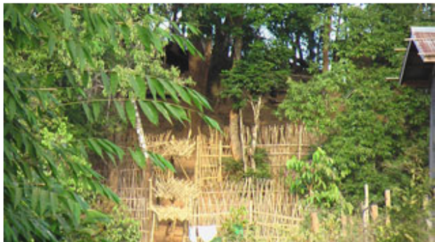
တၢ်ဂီၤအံၤဘၣ်တၢ်ဒီးအိၣ်ဖဲလၢဖျၢၣ်အါရံၤ(၄)သီၣ်၂၀၀၆န့ၣ်ဒီးဒုးန့ၣ်ဖျိဝဲကီၢ်သုးအ (နအဖ)သုးကလေးလၢအအိၣ်လၢထီၣ်တထူၣ်ကီၢ်ဆၣ်အပူၤန့ၣ်လီၤ. သုးလၢအဆိလီၤသးခဲအံၤမ့ၢ်ခမရ(၄၂၇)တုၣ်ခိၣ်ခိၣ်တီခိၣ်ရဲဖဲန့ၣ်လီၤ. သုးတဖုအံၤမၤဆူၣ်မၤစးသဝီဖိလၢအအိၣ်ဘူးတဖၣ်ကစီၣ်ထွဲမၤအဝဲသ့ၣ်လၢဟီၣ်ကဝီၤအပူၤန့ၣ်လီၤ.

တၢ်ဒုးအိၣ်ထီၣ်တၢ်နီၣ်ဖိၣ်လီၢ်လၢအဘူး ဒီးကျဲမ့ၢ်ကျဲဘိဒီး သုးကလေးတဖၣ်ဒီးတၢ်မၤဆူၣ်သဝီဖိ သုးလီၢ်သုးကျဲအါအါဂီၢ်ဂီၢ်ဆူဟီၣ်ကဝီၤ 13 သ့ၣ်တဖၣ်အံၤအပူၤန့ၣ် မ့ၢ်ကျဲတဘီလၢနအဖသုးမ့ၢ်ဖဲကညီကီၢ်ဖဲအပူၤတဖၣ်သ့ၣ် ဒ်သိးဒီးကမၤလီၤတၢ်ဝဲထံဖိကီၢ်ဖိတဖၣ်မၤအတၢ်မၤဆူၣ်တၢ်မၤ(မ့)ကဲထီၣ်အဝဲသ့ၣ်အဂံၢ်အဘၢတဖၣ်ကသုအင်္ဂါလီၤ. တၢ်လီၢ်တတီၤ လၢ အ မ့ၢ်ဖျဆၣ်လိၣ်ဖဲထီၣ်တထူၣ်ကီၢ်ဆၣ်အပူၤ လၢအဘၣ်တၢ်ဒုးအိၣ်ထီၣ် အိၣ်တၢ်နီၣ်ဖိၣ်အလီၢ်တတီၤဖဲသဝီဖိလၢအအိၣ်ဖဲယၢလိၣ်, ဖျိဘိဒေး, လုဟီၣ်လိၣ်, ပါးဖးဒီးဖျဆၣ်လိၣ်(သဝီလီၢ်လံၤ) 14 တဖၣ်အင်္ဂါ န့ၣ်လီၤ. ဟံၣ်ခိၣ်အဖျၢၣ်(၁၆၀)လၢပှၤနီၣ်ဂံၢ်အိၣ်ဝဲ(၉၀၀)ဘျဲၣ်ဂၤအံၤ ဘၣ်တၢ်သုး အဆူၣ်အလီၢ်အကျဲ ဆူဖျဆၣ်လိၣ် စးထီၣ်လၢ ၂၀၀၆န့ၣ်လံၤလံၤန့ၣ်လီၤ. ခုၣ်အုၣ်အုၣ်ကွဲၣ်မၤနီၣ်မၤယါဝဲဘၣ်ယး တၢ်မၤဆူၣ်မၤစးလၢနအဖ အသုးတဖၣ် မၤဝဲလၢဖျဆၣ်လိၣ်အပူၤန့ၣ်လီၤ. 15 ဒ်ခဲၣ်အုၣ်အုၣ်ကွဲၣ်ပှၤ ထၢတၢ်ကစီၣ်ဖိဖိဖျထီၣ်ဝဲဖဲလၢဖျၢၣ်အါရံၤ(၉)သီၣ်၂၀၀၆န့ၣ်အသးခလရ(၂၆၀)ဘၢတၢ်တီခိၣ်ရိၣ်ခဲအိၣ်လၢ သုးခိၣ်ရဲရဲနီၣ်လၢ အအိၣ်ဆိ လီၤအသးဖဲဖျဆၣ်လိၣ်တဖုဟ့ၣ်လီၤတၢ်ကလုၢ်လၢ သဝီဖိ တဖၣ်ကဘၣ်ကျိၣ်ခိးဆုၢ်အဝဲသ့ၣ် ဆူအသုးကလေးန့ၣ်လီၤ. ဒီးဟံၣ်တဖျၢၣ်န့ၣ် ကဘၣ်ဟ့ၣ်ဝဲဝဲလၢအထီၣ်အိၣ်(၁၂)ခိၣ်ယီၢ်ယဲၢ်ဘိစုၣ်စုၣ်န့ၣ်လီၤ.