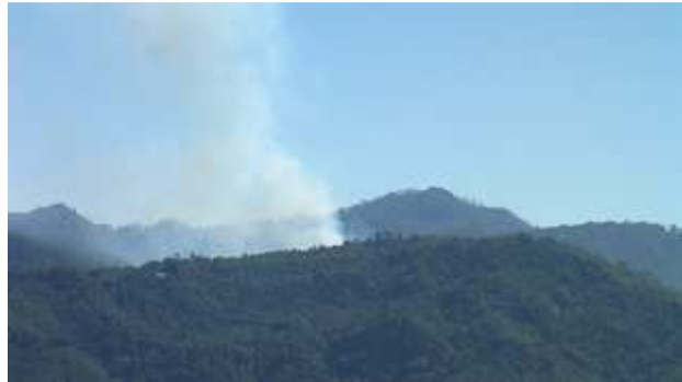
တၢ်ဂီၤအံၤဘၣ်တၢ်ဒီးအံၤဖဲဖျါအါရံၤ(၈)သီ ၂၀၁၀န့ၣ်အနံးဒီးဒုးန့ၣ်ဖျါ ထီၣ်မ့ၢ်အူအစ့ၣ်လၢမးအံးကျိးလၢအဘၣ်တၢ်ဒွဲၣ်အူအံၤဖဲချၢၣ်လၢဒီးဘုဆၣ်ခံ ကျဲမ့ၢ်မ့ၢ်, ဝံးဖဲဒါဒီးဖျါမူဒါအဘၣ်စၢန့ၣ်လီၤ. နအဖသုးတဖၣ်ဖဲအဟးဆၣ်တၢ် အခါဒွဲၣ်အူကွဲၣ်ဝဲသ့ၣ်ဖိဝဲၣ်ဖိနီၣ်ဖိမဲၤတဖၣ်သ့ၣ်ဒီးမးအံးကျိးတဖၣ်ဖဲတၢ်ဆူတၢ် အိၣ်တဖၣ်အူသုးကလၢ တဖၣ်အခါန့ၣ်လီၤ. (တၢ်ဂီၤ-ခ့ၣ်အူအိၣ်ကွဲၣ်)

တၢ်ဒုးသ့ၣ်ညါသဝီဖိဖဲဟီၣ်ကဝီၤတဖၣ်လီၤတၢ် လီၤ ဆဲးတအိၣ် ဘၣ် အယိတၢ် မ့ၢ်တၢ်ထီၣ်ဒုးအဝဲသ့ၣ်အမးအံးကျိးတဖၣ် ဒီးသဝီဖိတဖၣ်တအိၣ်ဒီးတၢ်ကဝဲၤကတိၤသးလၢ ကျဲအဂၤတဖၣ်ဘၣ်န့ၣ်လီၤ. တၢ် နွဲၣ်အူမးအံးကျိးအံၤကဲထီၣ်တၢ်ဟးဂီၤဒိၣ်ဒိၣ်မ့ၢ်မ့ၢ်လၢ တၢ်သ့ၣ်တၢ်ဖျး လၢ