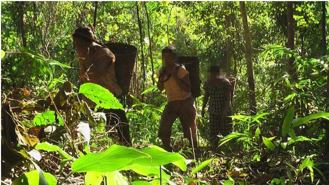
တၢ်ဂီၤတဘၣ်အဲၤဘၣ်တၢ်ဒီးန့ၢ်အိၣ်ဖဲလၢယနူၤအါရံၤ(၁၂)သီ ၂၀၁၀န့ၣ်ဒီးဒုးန့ၣ်ဖျါထီၣ်ဝဲသဝီဖိလၢသဝီအါဖျၢၣ်တဖၣ်ဘၣ်တၢ်မၤဆူၣ်အဝဲသ့ၣ်လၢဝဲစိတီဆူတၢ်အိၣ်တဖၣ်လၢ နအဖ အသုးရၣ် ၁၆၇(၄၂၅) စးထီၣ် လၢကီၢ်သုဒၤ သုးကလၢတုၤဆူသအူထၣ်သုးကလၢ, ထီတထူၣ် ကီၢ်ဆၣ်အပူၤန့ၣ်လီၤ.

ဖဲလၢအိးကထိဘၣ်ဒီးလၢနီၣ်ဝဲဘၣ်တၢ်စူၤဘူးကလၢၢ်န့ၣ် နအဖသုးထံးလၢအဟူးဂဲၤဖဲတီအူကီၢ်ရၣ်အပူၤတဖၣ်စးထီၣ်ဆူၣ်ဝဲတၢ်အိၣ်ဆူ အဝဲသ့ၣ်အ သုးကလၢလၢအဆိလီၤအသးလၢကျဲမ့ၢ်ခိၣ်တဖၣ်န့ၣ်လီၤ. 6 လၢကျဲမ့ၢ်တၢ်အိၣ်သးအဖိခိၣ်ဆူတၢ်အိၣ်တုၤလီၤ လၢနီၣ်ဝဲဘၣ်(မ့)လၢယနူၤအါရံၤ န့ၣ်လီၤ. တၢ်ဖိတၢ်လံၤတဖၣ်ဘၣ်တၢ်တီဆူၤအီၤလၢသိလုၣ် စးထီၣ် လၢ န အဖ ကလံၤထံးဟီၣ်ကဝီၤသုးအဝဲလၢလီၢ်ခိၣ်သ့ၣ်(တပခ) 7 ဖဲတီအူဇုၢ် ပူၤ ဒီးဆူအသုးတၢ်လီၢ်လၢအအိၣ်ထီၣ်ဒီးအိၣ်ဆိလီၤအသးလၢတီအူဒီးချၢၣ်လၢကျဲမ့ၢ်ခိၣ်, ချၢၣ်လၢနီၣ်ဒီးမိၣ်ခဲးကျဲမ့ၢ်ခိၣ်, ချၢၣ်လၢနီၣ်ဒီးဘုဆၣ် ခံကျဲမ့ၢ်ခိၣ် ဒီးဆူဇုၢ်ကိးဝဲ ဆူဝဲၣ်လဲၣ်ဝဲ, ချၢၣ်လၢနီၣ်, ကျဲၣ်စိခံ, သအူထၣ်, ကီၢ်သုဒၤ, နီစိဒီးဘုဆၣ်ခံတဖၣ်န့ၣ်လီၤ. လၢတၢ်ဆူအံၤအဂီၢ် သူဝဲအသုးသိလုၣ်တဖၣ်ဒ်အဟံပနီၣ်ယၢ်ဝဲအသိးဒီးမၤဆူၣ်ထံဖိကီၢ်ဖိအသိလုၣ် ဒီး(ဖဲးကဲး) 8 တဖၣ်န့ၣ်လီၤ. ဒီးတၢ်ဆူတၢ်အိၣ်ခံပတီၢ် တပ တီၢ် အတၢ်ရဲၣ်တၢ်ကျဲၤလၢက ဘၣ်မၤဝဲတဖၣ် မ့ၢ်တၢ်ဝဲစိတီဆူတၢ် အိၣ်တဖၣ်လၢသုးအ တၢ်ဟ်ကီၢ်ယၢ်အလီၢ်တဖၣ် လၢအအိၣ်ဆိလီၤ အသးလၢကျဲ မ့ၢ်တဖၣ်အဖိခိၣ် ဆူသုးကလၢတဖၣ်လၢအအိၣ်စီၤစူၤ ယံၣ် ဒီးတၢ်ခဲၣ်ညါဟီၣ်ကဝီၤတဖၣ်န့ၣ်လီၤ. တၢ်အံၤမ့ၢ်အကတီၢ်ဖဲလၢ ယနူၤအါရံၤ ဒီးလၢမးရူးအဘၣ်စၢၤတၢ်ဆၢကတီၢ်တဖၣ်ဒီးတၢ်ဆူတၢ်အိၣ်န့ၣ်ဝဲၤဝဲဂုၤဂုၤခိဖျိတၢ်မၤဆူၣ်သဝီဖိလၢအအိၣ်ဘူးဒီးသုးကလၢတဖၣ်ဝဲတၢ်ဒီးသုးဇုၢ်ကိးဝဲပုၤယိၣ်ဖိလၢကီၢ်ပယိၣ်ယိၣ်ပူၤ 9 တဖၣ်ဒ်ခွဲၣ်အုၣ်အုၣ်ကွဲၣ်အတၢ်မၤနီၣ်မၤယါအိၣ်ဝဲလၢအပူၤကွဲၣ်တဖၣ်အသိးန့ၣ်လီၤ.