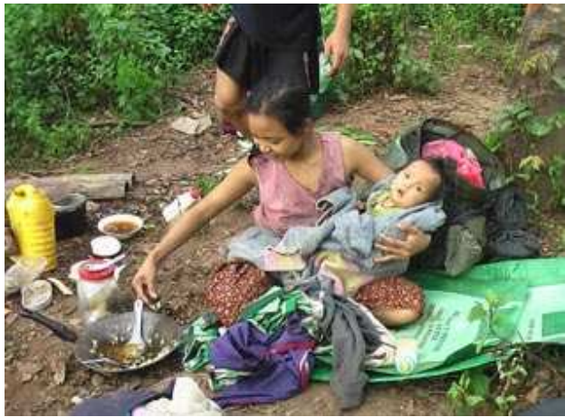
တံးဂီၤတဘၣ်အံၤဘၣ်တံးဒီးန့ၣ်အိၣ်ဖဲလၢနီၣ်ဖိုၣ်ဝဲဘၣ်(၁၉)သီ ၂၀၀၉နံၣ်န့ၣ်ဒီးဟံးဖျိ ထီၣ်ဝဲသ အ ခဲသဝိဖိတဖၣ်ဖဲထီၣ်တထၣ်ကီၢ်ဆၣ်အပူၤဖဲအဝဲသ့ၣ်ယုၢ်ပူၤဖျဲးအ သးဆူၣ်ပူၤလၢနအဖ အ ပူၤဟူးဂဲၤတဖၣ်ဟူးဂဲၤဖဲတံးဆူၣ်အိၣ်အကတီၢ် ဖဲ ၂၀၀၉နံၣ်တံးဂူၤခါဝဲၤအလီၤခဲန့ၣ် လီၤ. (တံးဂီၤ-ဒုၣ်အုၣ်အုၣ်ကွၢ်)

ဖဲလၢအုၣ်ထီၣ် ၄သီ ၂၀၁၀နံၣ်န့ၣ်သဝိဖိလၢ၈...ဒီးတ... တံး နီၣ်ဖိုၣ်အလီၤလၢသၣ်တီၣ်ကီၢ်ဆၣ်တဖၣ်လၢဝဲ ဆူၣ်...သဝိလၢ ထီ တထၣ်ကီၢ်ဆၣ်အပူၤ ဒီးသဝိလၢအဝဲသ့ၣ်ဟံးတံးကွၢ်ဝဲဖဲ ၂၀၀၆ နံၣ်န့ၣ်အသးဖိ အတံးသးဆူၣ်လီၤသးကျဲဝဲၤအလီၤခဲန့ၣ်လီၤ. သဝိဖိတဖၣ်တဲဘၣ်ဝဲခဲအုၣ်အုၣ်ကွၢ် ဝဲပျီၤပုၤမၤတံးဖိလၢအဝဲ သ့ၣ်ကွၢ်ကျဲးစးလၢကက့ၤအိၣ်က့ၤဆူၣ်... သဝိခိဖျိတံးလီၤ လၢ တံးသးဆူၣ်အိၣ်တဖၣ်အပူၤန့ၣ်တအိၣ် ဒီးတံးဖံးအိၣ်မၤအိၣ်အ လီၤလၢလၢပဲၤပဲၤလၢ တံးလုၢ်အိၣ်သးသမူအဂီၢ်ဘၣ်ဒီးအဝဲသ့ၣ် မုၢ်လၢလၢကမၤအိၣ်ဘၣ်က့ၤအစးအကျိးလီၤလံၤတဖၣ်လၢတံး န့ၣ်န့ၣ်အပူၤန့ၣ်လီၤ. သဝိဖိတဖၣ်က့ၤဆူၣ်...သဝိအခါ နအဖ အသးကျိၤတဖၣ်ဘၣ်သ့ၣ်သ့ၣ်ကမုၢ်ခမရ(၄၂၁) 28 လၢအဟူးဂဲၤဖဲ ဟီၣ်ကဝီၤအံၤအပူၤထံၣ်န့ၣ်အဝဲသ့ၣ်ဒီးခးအဝဲသ့ၣ်န့ၣ်လီၤ. သ ဝိဖိလၢအက့ၤကတဲၤတဖၣ်ယုၢ်ပူၤဖျဲးအသး ဒီးခိးတံးတုၤမုၢ် ဆၣ်ထီၣ်တနံၤလၢအမုၢ်လၢအုၣ် (၅)သီဖဲအဝဲသ့ၣ်ကွၢ်ကျဲးစး လၢကန့ၣ်လီၤက...သဝိအခါ နအဖသးလၢအဟူးဂဲၤတဖၣ် ထံၣ်န့ၣ်ကဝီၤကဝဲသ့ၣ် ဒီးခးကဝီၤအဝဲသ့ၣ်န့ၣ်လီၤ. သဝိဖိတဖၣ် အံၤယုၢ်ပူၤဖျဲးအသးလၢအ တအိၣ်ဒီးတံးဘၣ်ဒီးဘၣ်ထံးဘၣ် ဆၣ်အဝဲသ့ၣ်တဖၣ်ဘၣ်တံးတြီယံၢ်အံၤ လၢကဖဲက့ၤကတဲၤဆူၣ်သဝိလၢအအိၣ်ဆိးဝဲခဲအံၤန့ၣ်လီၤ. ဒီးတံးလုၢ်အိၣ်သးသမူအတံးကီၢ်တံးခဲတ ဖၣ်လၢအဝဲသ့ၣ်ဘၣ်ကွၢ်ဆၣ်မဲၣ်ဝဲဖဲတံးနီၣ်ဖိုၣ်အလီၤတဖၣ်န့ၣ်အိၣ်ဒီးဒုၣ်အတံးန့ၣ်လီၤ.