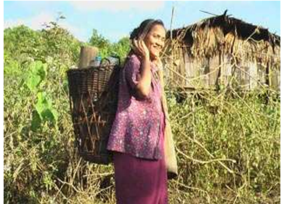
တၢ်ဂီၤအံၤဘၣ်တၢ်ဒိၣ်န့ၣ်အိၣ်ဖဲလၢအိၣ်ကထီၣ်ဘၣ်(၂၀)သီ ၂၀၀၉န့ၣ်ဒီးဒုးန့ၣ်ဖျါ ထီၣ်ဝဲသဝီဖဲအခးဒဲတဖၣ်ဖဲတၢ်အိၣ်ခူသ့ၣ်အလီၤတတီၤလၢအအိၣ်ဘူးဒီးတအ့ ခဲ, ထီတထူၣ်ကီၣ်ဆၣ်န့ၣ်လီၤ. သအ့ခဲသဝီအံၤဘၣ်တၢ်ဟံၣ်တ့ၢ်က့ၣ်အိၣ်ဖဲ ၂၀၀၆ န့ၣ်အပူၤခိၣ်ဖျါန့ၣ်အဖအတၢ်ဟူးတၢ်ဂဲၤတဖၣ်ဘၣ်ဆၣ်သဝီဖဲအါဂၤအိၣ်ဒံးဒံးဒၣ်လၢ တၢ်အိၣ်ခူသ့ၣ်အလီၤလၢအဘူးဒီးသအ့ခဲသဝီဒီးဂုၢ်ကျါစားကျါမၤအိၣ်ဒံးအခး တဖၣ်န့ၣ်လီၤ.