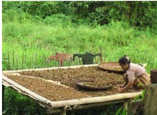
တၢ်ဂီၤအံၤတၢ်ဒီးန့ၢ်အီၤဖဲလါနီၣ်ဝဲဘၣ်(၁၉)သီ ၂၀၀၉န့ၣ်လၢအဒုးန့ၣ်ဖျိထီၣ်လီၤအိၣ်ကမ့ၢ် သဝီဖိတဂၤလၢအဟဲလၢရီၣ်ခိၣ်သဝီ,သ့ၣ်တီၣ်ကီၢ်ဆၣ်, လိဗုလီၤဝဲမးအံးရဲတဖၣ်ဖဲအထုး ဖိၣ်တၢ်ဖိၣ်ဝဲဝဲအလီၤခဲန့ၣ်လီၤ. တီအူသဝီဖိအါဂၤသ့ၣ်မးအံးအါထီၣ်မ့ၢ်လၢမးအံးမ့ၢ်တၢ်ဖိ တၢ်လံၤလၢအတူၢ်ဒီး ဖဲဝဲညီဝဲလၢတၢ်ကဝဲအီၤဖိအီၤဆူတၢ်လီၤအယၢ် လၢတၢ်ကပူၤအီၤ ဆါအီၤ ဒ်သိးကမၤန့ၢ်ဘၣ်တၢ်အိၣ်ဒီး တၢ်အဂၤဒ်အမ့ၢ် ဂံၢ်ခိၣ်ထံးတၢ်လိၣ်တဖၣ်န့ၣ်လီၤ.

စးထီၣ်လၢ လါယန့ၤအါရံၤတူၤလီၤလၢလါမ့ၢ်အကတၢ်န့ၣ်ဒ်ပ ဝံးတၢ်အ သိးမ့ၢ်ဝဲတၢ်ထုးဖိၣ်တၢ်ဖိၣ်က့ၤသ့ၣ်ဖျးတၢ်သ့ၣ်တဖၣ် ဒီးတၢ်ဆါ သ ဘျီၣ်လၢအဆၢကတီၢ်န့ၣ်လီၤ. သဘျီၣ်လၢအပူၤ ဆိတလဲအသးကိးလါဒဲး ဒ်အဒီးသန့ထီၣ်အသးလၢတၢ်ဖိတၢ် လံၤအဖိခိၣ်အသိးန့ၣ် လီၤ. ဝဲလါမးရူးအပူၤန့ၣ်အပူၤထီၣ်ဝဲဒ်ၣ်ပီၤန့ၣ်လီၤလၢစု ၃,၀၀၀ကွး(၃.၀၆အမဲရကၤဒီလၢ)တူၤလၢ၅,၀၀၀ကွး(၅.၁၀အမဲရကၤဒီလၢ)