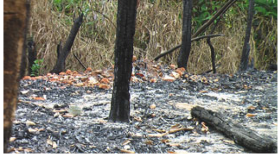
တၢ်ဂီၤခဲၣ်ဘၣ်အံၤဘၣ်တၢ်ဒိၣ်န့ၣ်အိၣ်ဖဲလၢအံၤဒုၣ်(၁၆)သီ ၂၀၁၀န့ၣ်ဒီးဟံၣ်ဖျါထီၣ်ဝဲတၢ်ခိးစီသဝီဖဲသၣ်တီၣ်ကီၣ်ဆၣ်အပူၤလၢအဘၣ်တၢ်ထီၣ်ဒုးအိၣ်လၢနအဖသးဖိတပ၀ တဖၣ်ဖဲလၢနီၣ်ဝဲဘၣ် ၂၀၀၉အပူၤန့ၣ်လီၤ. ဒ်ခ့ၣ်အ့ၣ်အၣ်က့ၣ်ပျီၤပူၤမၤတၢ်ဖိတဖၣ်ဟံၣ်ဖျါဝဲအသိးဟံၣ်ခိၣ်အဖျါ(၂၀-၃၀)လၢပူၤနီၣ်ဂံၢ်အိၣ်ဝဲအါန့ၣ်ဒံး (၂၀၀) ဂၤဃုာ်ဝဲဒၣ်တၢ်ထီၣ်ဒုးန့ၣ်လီၤ. ဖဲဃုာ်တၢ်ထီၣ်ဒုးအခါသဝီဖဲခဲဂၤဘၣ်တၢ်ထံၣ်ဒီးခးအဝဲသ့ၣ်ဒီးသဝီဘၣ်တၢ်ဒွဲၣ်အုၣ်က့ၣ်အိၣ်န့ၣ်လီၤ. သဝီဖိတဖၣ်အိၣ်ဒံးဒံးတၢ်လၢတၢ် အိၣ်ခူသ့ၣ်အလီၤဒီးသးတၢ်အိၣ်လၢကက့ၤကဒါက့ၤဆူတခိးစီဘၣ်ခိၣ်ဖျါန့ၣ်အဖအတၢ်ဟူးတၢ်ဂဲၤတဖၣ်အိၣ်ဒံးဖဲဟီၣ်ကဝီၤပူၤအပိၤလီၤ.