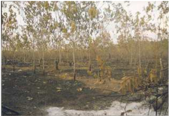
တၢ်ဂါတဘျီအံၤတၢ်ဒိန့ၣ်အါဖဲလါအူၣ်ဖြၣ် ၂၃၁၁၀နံအပူၤန့ၣ်လီၤ. ဒီးဟံၣ်ဖျါကီၢ် ကျိးလါတၢ်အမ့ၢ်စိၤ တ... အတၢ်န့ၣ်လီၤ. ကီၢ်ထူၣ် ၁,၃၇၀ ထူၣ်လါကီၢ်ကျိၣ်တ ဘၣ်အံၤအပူၤန့ၣ်ဟးဂါကွဲၣ်ဖဲဒုၣ်လၢၣ်ဒီးတၢ်ကဘၣ်က့ၤသ့ၣ်လီၤကဒါက့ၤအါ အသိန့ၣ်လီၤ. (တၢ်ဂါ-ခွဲအုပ်အုပ်ကွဲ)

ဖဲလါအူၣ်ဖြၣ် ၂၃၁၁၀နံနံၤန့ၣ်အဖသုးခလရ#၅၄၈ သုးကျိၤခံကျိၤလါဟံၣ်ယုၢ်သုးဖိခဲလၢၣ်(၇၀)ဂါန့ၣ်လီၤဖဲဖဲဖဲ...သဝိ.ဝီၢ်ရီ(ဝင်းယော်) ကီၢ်ဆၣ်ဖဲဒူပျာ်ယာ်ကီၢ်ရှၢ်ပူၤဒ်အမ့ၢ်တၢ်ဟူးတၢ်ဂါလါအဒိၣ်ကတၢၢ်တဘျီလါဖဲ... ဟီၣ်ကဝီၤဒိတဘျီအပူၤန့ၣ်လီၤ. မ့ၢ်ဆၣ်ထီၣ်တနံၤဖဲ လါအူၣ်ဖြၣ် ၂၃၁၁၀နံ သုးကျိၤလါအဘၣ်တၢ်တိခိၣ်ရိၣ်ဖဲအါလါသုးခိၣ်အိၣ်ကွီၣ်စိလဲၤန့ၣ်ဖဲဖဲ ဖဲ...သဝိလါအိၣ်စိၤစုၤဒီးဖဲ...သဝိတန့ၣ်ရံၣ် ကျဲန့ၣ်လီၤ. တၢ်တယာ်ကွဲၣ်လါကဘၣ်ဖဲ ဂါခိ ၁၀န့ၣ်ရံၣ်န့ၣ်အဖဲသ့ၣ်သုးဘူးထီၣ်အသးအူၣ်ကီၢ်ကျိးဖဲဒဲဖျၢၣ်အမ့ၢ်စိၤတ... ၂၇နံၣ်ဒီးစိၤမ... ၃၇နံၣ်ဒီးပုၤသဝိဖိခံဂါမ့ၢ်သဝိဖိလါဖဲ...သဝိန့ၣ်လီၤ. ၂