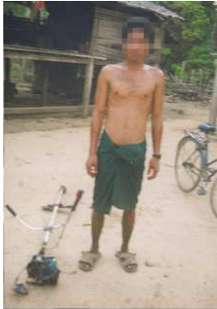
တၢ်ဂီၤတဘျီအံၤ တၢ်ဒိန့ၣ်အိၣ်ဖဲ လၢအဖြၢၣ် ၂၀၁၀န့ၣ်, ဟ်ဖျါဝဲ စီၤတ..., လၢအကီၢ်ကျိးဘဉ်တၢ်မၤဟးဂီၤအိၣ် လၢ နအဖသး ခလရ#၅၄၈ခးကျိးဒီးတၢ်တံးဒီးမ့ၣ်အုၣ်အိၣ်ကွံၣ်တီၢ်ကျိးဖဲ လၢအဖြၢၣ် ၂၃သီ ၂၀၁၀န့ၣ် န့ၣ်လီၤ. စဲးကူးနီၣ်ဒိဖျါလၢစုၣ် လၢကမၤဖျါအကီၢ်ကျိး န့ၣ်မ့ၣ်အုၣ်အိၣ်ဟးဂီၤ ကွံၣ်ဝဲဒၣ်စၢ်ကိး န့ၣ်လီၤ.

စီၤတ... ဒီး စီၤမ... ဘဉ်သ့ၣ်သ့ၣ်ပျံၤဖျါကိးဝဲလၢ တၢ်ကဟ်ဒုၣ်ဟ်ကမၢ်အဲသ့ၣ် ဟ့ၣ်တၢ်ဆီၣ်ထွဲမၤစၢၤဆူခွၢ်အဲၣ်အဲၣ်လဲအုၣ်အဲၣ်န့ၣ်လီၤ. ကျိးဒဲး လၢအမ့ၢ် သ ဝိဖိအတၢ်န့ၣ် တဘျီတခါခိၣ် ခွၢ်အဲၣ်အဲၣ်လဲအုၣ် အိၣ်ကဒုဝဲအဲသ့ၣ်ဟးဝုၤဝီၢ်အ ဆၢကတီၢ်အခါန့ၣ်လီၤ. လၢတၢ်မၤဆၢကဒါက့ၤတၢ်တခါ နအဖသးဖိ ဟ်ဒုၣ်ဟ်က မၢ်ဒဲကစၢ်တဖၣ်လၢ, လီၢ်ဆီဒုၣ်တၢ်လၢအဆီၣ်ဖဲဒဲပူၤတဖၣ် လၢအပျဲအိၣ်ကဒု ခွၢ်အဲၣ်အဲၣ်လဲအုၣ်သးဖိလၢအဟီၣ်ခိၣ်လီၢ်အဖိခိၣ်တဖၣ်န့ၣ်လီၤ. သဝိဖိလၢတၢ် ဟ်ဒုၣ်ဟ်ကမၢ်အိၣ်န့ၣ်တဖၣ်ညီၣ်န့ၣ်ကထီၣ်အသး ဝဲတၢ်ဒုးပူၤနအဖသးဖိတဖၣ် ဘဉ်ဒဲးမ့တမ့ၢ်ယီၢ်ဘဉ်ခွၢ်အဲၣ်အဲၣ်လဲအုၣ်မ့ၣ်ပိၣ်န့ၣ် သဝိဖိတဖၣ်ဘဉ်တၢ်မၤတီၢ် အိၣ်, တၢ်မၤပယုဲမ့တမ့ၢ်တၢ်မၤဟးဂီၤအတၢ်ဖိတၢ်လဲၤတဖၣ်န့ၣ်လီၤ. ၄ နအဖသးဖိ တဖၣ်မၤဟးဂီၤမ့တမ့ၢ် န့ၣ်အုၣ်ကွံၣ်ဒဲးတဖၣ်, မ့တမ့ၢ် ဟ့ၣ်တၢ်ကလုာ်လၢသဝိဖိတဖၣ် ကဘဉ်ယိလီၤကွံၣ်ဝဲန့ၣ်လီၤ. ၅ ဘဉ်ယးခွၢ်အဲၣ်အဲၣ်လဲအုၣ် ဖါပြဲးကလံၤစိး ဖဲ လုၤချၢၣ်သဝိတၢ်ဂ့ၢ်အိၣ်, နအဖသးခလရ#၁၆မၤပျံၤမၤဖုးသဝိဖိဟ်ဒုၣ်လၢအဆီၣ် ဘူးထီၣ် တၢ်ဒုးစဲးပြဲးကထီၣ်အလီၢ်အိၣ်ဒီး န့ၣ်အုၣ်ကွံၣ်သဝိဖိအဲၣ်လၢပုၤယုၢ်ဒီးတၢ် ဖိတၢ်လဲၤခဲလၢၣ်န့ၣ်လီၤ. ၆ နကျဲသန့ၤလၢကဒိသဒေလီၤက့ၤနီၢ်ကစၢ်သးလၢ တၢ်ဟ့ၣ် က့ၤတၢ်ကမၢ်ဒဲန့ၣ်တဖၣ်အဂီၢ်, သဝိဖိတဖၣ်တဘျီတခါ ယုၤကညးဝဲ ခွၢ်အဲၣ် အဲၣ်လဲ အုၣ်သးဖိတဖၣ် လၢတဘဉ် ခးလိာ်သးဒီး နအဖသးဖိမ့တမ့ၢ် ဒီးလီၤမ့ၣ် ပိၣ်လၢအဲသ့ၣ်ဟီၣ်ကဝီၤပူၤတဂ့ၤန့ၣ်လီၤ. ၇