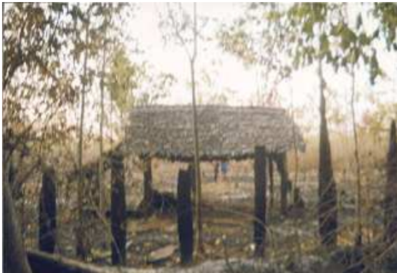
တၢ်ဂါတဘျီအံၤတၢ်ဒိန့ၣ်အါဖဲ လါအူၣ်ဖြၣ် ၂၃၁၁၀နံအပူၤန့ၣ်လီၤ. ဒီးဟံၣ်ဖျါကီၢ် ဒဲလါအူၣ်အိၣ်ဒီးကီၢ်ကျိးလါအမ့ၢ်စိၤ မ... အတၢ်န့ၣ်လီၤ. ကီၢ်ထူၣ် ၁,၃၇၀ ထူၣ်လါကီၢ်ကျိးတဘျီအံၤအပူၤန့ၣ် ဟးဂါကွဲၣ်ဖဲဒုၣ်လၢၣ် ဒီးတၢ်ကဘၣ်က့ၤ သ့ၣ်လီၤကဒါက့ၤအါအသိန့ၣ်လီၤ.(တၢ်ဂါ-ခွဲအုပ်အုပ်ကွဲ)

စိၤတ...ဒီး စိၤမ...တဲလဲလါအဖဲသ့ၣ်ထီၣ်ခွဲအဲၣ်အဲၣ်လ်အူၣ်သုးဖိယဲၢ်ဂါလါသုးရၣ်#၁၆ဟးဆုးကွၢ်တၢ်ဖဲတရူးလါ နအဖသုးခလရ#၅၄၈ တရူးဟဲတုၤဒ်ဘၣ်အခါန့ၣ်လီၤ.ခွဲအဲၣ်အဲၣ်လ်အူၣ်သုးရၣ်#၁၆အံၤဟူးဂါဖဲဖဲ ၂...သဝိခိၣ်ယၢၤဒီးဒူပျာ်ယာ်ကီၢ်ရှၢ်ဟီၣ်ကဝီၤအါတက့ၢ်န့ၣ် အိၣ်ဖဲဒုၣ်လါ တၢ်ခိၣ်ထီၣ်လိၣ်သးအလီၢ် ဖဲ သုးတၢ်ထီၣ်ဒုးဒိၣ်ဒိၣ်မ့ၢ်မ့ၢ်ဖဲ ၁၉၉၇နံၣ် ဒီး ခွဲအဲၣ်ယုၢ်.ခွဲအဲၣ်အဲၣ်လ်အူၣ် ဟူးဂါက့ၤဖဲဒုၣ်လါ