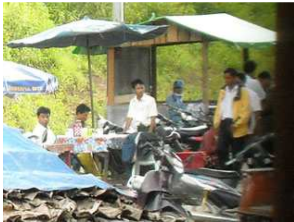
တံၤဂီၤလၢစုထွဲန့ၣ်ပာ်ဖျါတာၢ်သမံသမိးအတြိၤဖဲအုၣ်ကျဲမ့ၢ်ဒိၣ်အဖိခိၣ်ဖဲတံးတံးမၤဟီၣ်ကဝီၤဒိၣ်လီၤဆိဖဲအအိၣ်သ့ၣ်ကညါနီၤဟီၣ်ကဝီၤဖဲရၣ်မတံတီၣ်ရၢန့ၣ်လီၤ. တံၤ ဂီၤလၢစုထွဲန့ၣ်မ့ၢ်တာၢ်သမံသမိးအတြိၤဖဲသ့ၣ်ကညါနီၤသဝီလၢအအိၣ်ဖဲရၣ်မတံတီၣ်ကိးတရံးအဘၢၣ်စၢၤန့ၣ်လီၤ. တြိၤတတီၤအံၤဘၣ်တံၤပၤယၣ်အီၤလၢနအဖသုးဖိ, တာၢ်သမံသ မိးပုၤခိ ကိၣ်အပုၤဘၣ်မူဘၣ်ဒါ(လဝက)တဖန်, နစကဒီးခၣ်ဘၣ်အုၣ်သုးဖိခၣ်ဖဲအိၣ်အသုးဖိတဖန်န့ၣ်လီၤ. တံၤဂီၤတဖန်အံၤတံၤပၤယၣ်အီၤဖဲလါအိၣ်ကူး ၂၇သီ ၂၀၀၉န့ၣ် န့ၣ်လီၤ.

တာၢ်ခိတံၤသ့ၣ်အတြိၤလၢတာၢ်သမံသမိးအတြိၤကိးတံၤဒဲးန့ၣ်, အထၢစုအါအိၣ်ဝဲဒၣ် (၈)တံၤဖဲရၣ်မတံတီၣ်ကဝီၤလိၣ်ကျိန့ၣ်လီၤ. တာၢ်သမံသ မိးအတြိၤ(၈)တံၤအံၤတံၤကူးပျါဒ်အနီၣ်ဂံၢ်ရၣ်အသိးစးထီၣ်လၢမ့ၢ်န့ၣ်ဒီးဆူမ့ၢ်ထီၣ်စးထီၣ်အသးဖဲရၣ်မတံတီၣ်န့ၣ်လီၤ.