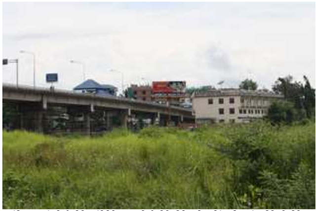
တၢ်ဂီၤလၢတၢ်ပၣ်ဖျါထီၣ်တၢ်ခိခိၣ်အံၤ ပၣ်ဖျါထီၣ်ကိၣ်တဲၣ်-ကိၣ်ပယီၤတၢ်ဂ့ၢ်လိၣ်လိၣ် အ တီၤလၢဒုးစဲဘူးကိၣ်ပယီၤဒီးကိၣ်တဲၣ်ကိၣ်လိၣ်ပတၢ်ဘၣ် ၂၀၀၉နံ၉ န့ၣ်လီၤ. ကိၣ်ပယီၤဝုၣ် ရၣ်မတံၣ်ဒုၣ် မုၢ်ကျဲၤဝဲကွၢ်အလိၣ်ခံသးဒီးတၢ်ထံၣ်သ့ၣ်လၢ တၢ်ဂီၤပူၤအသးအံၤန့ၣ်လီၤ.

ရၣ်မတံၣ်ဒုၣ် အိၣ်သ့ၣ်လီၤအသးဖဲ ကိးတရံးကိၣ်ဆၢ, ဖၣ် အၣ် ကိၣ်ရၣ် အ ပူၤ ကိၣ်ပယီၤကိၣ်ဆၢလိၣ်လိၣ်အသးဒီး ကိၣ် တဲၣ်တၢ် ဖဲဆိးန့ၣ်လီၤ. ဝုၣ်ခံ ဖျါၣ် အံၤ တၢ် ဒိၣ်အဆၢလၢ သ့ၣ် ကျဲၤလၢအယုၤလီၤဝဲ ဆူကလံၤစိးတုၤကိးလိၣ် အသးဒီးယိၣ် လိၣ်ကျိန့ၣ်လီၤ. ပူၤကွၢ်အနံၣ်ခံဆံဘျးန့ၣ်,ရၣ်မတံၣ်ဒုၣ်အံၤ အိၣ်ဝဲဒုၣ်လၢကညိဒီကလုာ်တၢ်ထုၣ်ဖျါသးမုၢ်ဒိၣ်(ခွဲအဲၣ် အဲၣ်လံအုၣ်)တၢ်ပၣ်တၢ်ဆါတၢ်ဖိလၢန့ၣ်လီၤ. ဝုၣ်အံၤကိၣ်ပယီၤ သးပၤဘၣ်က့ၤဝဲဖဲ အဟဲမၤတၢ်ထီၣ်ဒုးဒိၣ်ဒိၣ်မုၢ်မုၢ်ဒီးသ့က တီယုၤဒီးတုၤလီၤမုၢ်ပီၤဖဲဝဲၣ်ၣ်န့ၣ်ဝံၤအလိၣ်ခံန့ၣ်လီၤ.