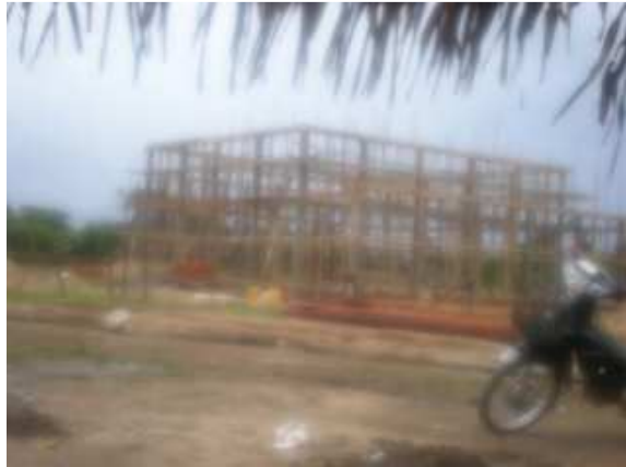
တၢ်ဂီၤတဘျီအံၤဒုးန့ဂ်ပျါဝဲမိၤစလုၤဖိတဖၣ်တုထီဂ်ပလံၤလၢအသီအဂီၤဖဲက တၢ်တံးသဝီချၢ တၢ်လီၢ်သီတတီၤဖဲဒံဂ်လိာ်ဆၣ်ပုၤဖဲ လၢယုၤ ၁၁သီ ၂၀၀၉န့ဂ် န့ဂ်လီၤ. ဒံဂ်ခုဂ် ဘဂ်အုဂ်သုးဖိတဖၣ်မၤဆုဂ်မိၤစလုၤသဝီဖိတဖၣ်ကယိလီၤကွံာ် ပလံၤ လၢအအိဂ်ဖဲကတၢ်တံးသဝီပုၤဒီးနီၣ်ဟးထီဂ်ကွံာ်စုၢ်ကိးမိၤစလုၤသဝီ ဖိ ဆု သဝီလီၤလံၤအချၢန့ဂ်လီၤ.

မိၤစလုၤလၢကီၢ်ပယီၤပုၤတဖၣ်ကွၢ်ဆၢမဲာ်ဘဂ်ဒီးတၢ်ဘုဂ်တၢ်ဘၢအ သုးမုာ်ဒီးအမုာ်ဒံဂ်ခုဂ်ဘဂ်အုဂ်လၢထံလီၢ်ကီၢ်ပုၤအတၢ်မၤအမၤသီ တဘျီယီၤန့ဂ်လီၤ. အပုၤကွံာ်တယံာ်ဒီးဘဂ် ဖဲဖဲပုဂ်ကီၢ်ရုဂ်ပုၤ တၢ် မၤ အမၤသီလၢအမုာ်တၢ်မၤဆုဂ်ယိလီၤကွံာ်ပလံၤ (ကီၤလီၤသု တၢ်ဘၢယုၤသရိၣ်) ဒီးတၢ်နီၣ်ဟးထီဂ်ဆုဂ်ကွံာ်ကီၤလၢသု (မိၤစလုၤ) တဖၣ်ဆုသဝီချၢန့ဂ်လီၤ.