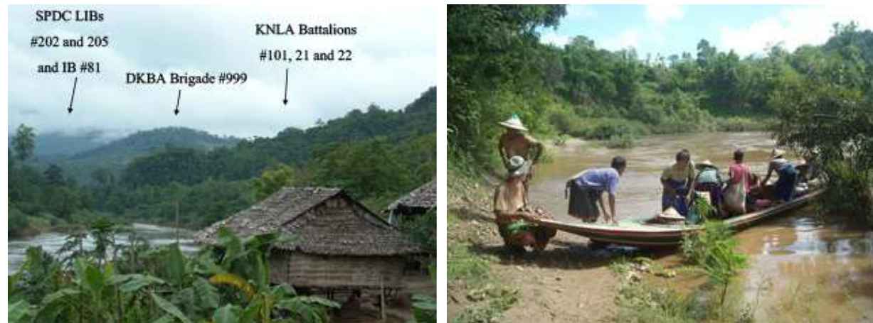
တင်ဟ်တဘ်အံၤဒုးန့ၣ်ဖျါဝဲနအဖဒီးဒိၣ်ခွဲၣ်ဘံၣ်အုၣ်သုးကလၢလၢအဖျါလၢတၢ်လီၤခဲန့ၣ်လီၤ. လၢတၢ်မဲၣ်ညါန့ၣ်အိၣ်ဒီးလၢဟ်ဟဟာဒဲကဝီလၢပုတအိၣ်အပူၤနီတဂၢလၢဘၣ်န့ၣ်လီၤ. လၢလၢဟဟာ ဒီးနအဖ/ဒိၣ်ခွဲၣ်ဘံၣ်အုၣ်ဒဲကဝီအဘၣ်စၢန့ၣ်အိၣ်ဝဲဒီးခွဲၣ်အိၣ်အိၣ်လံအုၣ်တၢ်လီၤန့ၣ်လီၤ. (တၢ်ဂီၤကညီၣ်ဂံၢ်တီၣ်ဒီးယံာ်ကရူၢ်)

တင်ကစီၣ်အဂါအတင်ဟ်ဖျါဘ်ယးသဝီမိအတင်ဟ်ယုာ်ထီၣ်န့ၣ် အနီၣ်ဂံၢ်တလီၤဆိဒီးပုအါအါဘ်. နကွါလုာ်ဟ်ဖျါဘ်အသိး. သဝီမိအါနံဒီး ၃,၄၀၀၈၂ဟ်ယုာ်ထီၣ်ဆူကီၢ်ကွီၣ်တဲၣ်ဒီးဟ်အိၣ်ကဒုဖ်အူသုၣ်ထပ်, မံဖျါ, ဒီးမံသရံးန့ၣ်လီၤ. ၂ Free Burma Rangers ဟ်ဖျါထီၣ်စ့ၢ်ကိးဝဲလၢသဝီမိ ၃,၂၉၅၈၂ဟ်ယုာ်ထီၣ်ဆူကီၢ်ကွီၣ်တဲၣ်ဒီးအိၣ်ဝဲဖဲ မဲၣ်အူစုးဒီးနီၤဘိစ့ၢ်ကိးန့ၣ်လီၤ. ၃