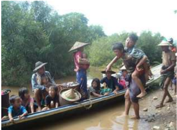
လၢပၤဟံးကဝီၤသဝီဖိသ့ၣ်တဖၣ်ပၤတၢ်ကွဲၣ်တၢ်လီၤတၢ်ကျဲၤ ဒီးယုၤထီၣ်ဆူကီၢ်ကီၣ် တဲၣ်လၢကဟးဆဲးဝဲနအဖဒီးဒံၣ်ခ့ၣ်ဘၣ်အုၣ်တၢ်ထီၣ်ဒုးန့ၣ်လီၤ. (တၢ်ဂီၤ ကညီဂ့ၢ်ဝိခွဲးယၢ်ကရူၢ်)

ဖဲလၢယုၤ ၅သီ ၂၀၀၉န့ၣ်န့ၣ်, ကညီဂ့ၢ်ဝိခွဲးယၢ်ကရူၢ် ဟံၤဖျါထီၣ်ဖဲ လၢသဝီဖိအါန့ၣ်ဒီး (၅၀၀)၀၀ယုၤထီၣ်ဆူကီၢ်ကီၣ်တဲၣ် ဖဲလၢယုၤ ၂သီ တုၤ ၅သီ ဒ်သိးကဟးဆဲးဝဲနအဖဒီးဒံၣ်ခ့ၣ်ဘၣ်အုၣ်အတၢ်မၤ ဆူဝံၣ်န့ၣ်သုးအတၢ်ဖိတၢ်လံၤ ဖဲအဲၣ်သ့ၣ်ပဲထီၣ်ဒုးခ့ၣ်အဲၣ်အဲၣ်လဲ အုၣ်တၢ်လီၤအခါန့ၣ်လီၤ. ခ့ၣ်အဲၣ်အဲၣ်လဲအုၣ်သုးကလၢအံၤ အိၣ်သ့ၣ်လီၤအသးဘူးဒီးလၢပၤဟံးကဝီၤပုၤလီၤအိၣ်ကမ့ၢ်ဖဲက ဝီလၢတၢ်ကြဲၣ်ကီၢ်ဆၢ, ဖၣ်အုၣ်ကီၢ်ရၣ်န့ၣ်လီၤ. တချုးတၢ်ဒုးကဲ ထီၣ်ဒုးဘၣ်န့ၣ် ပုၤလီၤအိၣ်ကမ့ၢ်ဖဲလၢလၢပၤဟံးကဝီၤသ့ၣ်တဖၣ် ယုၤ ထီၣ်ဟံးစၢလံၤဒီးဖဲ လၢယုၤ ၅သီအနံၤန့ၣ်, လၢပၤဟံးကရူၢ်လၢ အအိၣ်တၢ်တဖၣ်ခဲလၢပၤဟံးယုၤလီၤဆူကီၢ်ကီၣ်တဲၣ်န့ၣ်လီၤ.