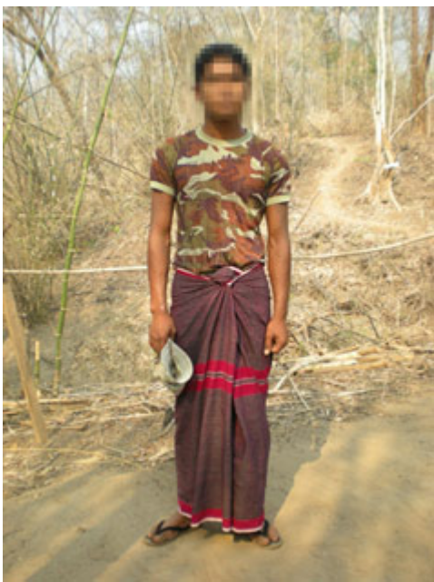
ကိုပယီၤသုးမ့ၢ်ဖျိး ကို-----, (၂၀)နံၣ်) ဘၣ်တံးဒိန့ၣ်အဂီၢ်ဖဲလၢအဖြၣ် ၂၀၀၀နံၣ်ဖဲအပှၤဖျိးကွၢ်လၢအသုးအကျိၣ်ဖဲကညီကီၢ်စဲၣ်အပှၤန့ၣ်လီၤ. (တံးဂီၤ ကညီဂံၢ်ဖိခွဲးယံၣ်တဂ့ၢ်)

အခိၣ်ထံးန့ၣ် ပှၤပိၣ်ခွါဖိအိတ်ခံၣ်ဂၤဂ့ၢ်ကျဲးစးယုၢ်ပှၤဖျဲးအသးဘၣ်ဆၣ်အဝဲသ့ၣ်တံးက့ၤဖိၣ်န့ၣ်ကဒါက့ၤအဝဲသ့ၣ်အယိတံးဟံးအိတ်လၢတံးဒုးယံၣ်အလီၢ် ၁၅သီန့ၣ်လီၤ. ဖဲန့ၣ်ဝဲၤအလီၢ်ခဲတံးပျီကွၢ်အဝဲသ့ၣ်န့ၣ်လီၤ. တရျးလၢပှၤခံၣ်အံၤဘၣ်တံးဒုးယံၣ်ဒီးအံၤဘၣ်န့ၣ်အဝဲသ့ၣ်ဘၣ်တံးတီၢ်အိတ်လၢပှၤဟ့ၣ်တံးမၤလိ သုထီၣ်န့ၣ်လီၤ. ပှၤဟ့ၣ်တံးမၤလိခဲလၢကအိတ်ဝဲဒၣ် (၁၀)ဂၤဒီး မ့ၢ်ပှၤထီၣ်တံးမၤလိဟံးယုၢ်ဒီးယတခီကအိတ်ဝဲဒၣ် (၂၃၆)ဂၤန့ၣ်လီၤ. လၢပှၤထီၣ်တံးမၤလိသ့ၣ်တဖၣ်အံၤအကျိၣ်ဖိသ့ၣ်ဟံးယုၢ်ဝဲဒၣ် (၅၀) ဂၤလၢတံးမၤလိအပှၤန့ၣ်လီၤ. လၢဖိသ့ၣ် (၅၀၀၀) အကျိၣ်အံၤန့ၣ်အသးနံၣ်ကအိတ်ဝဲဒၣ် ၁၆နံၣ်ဒီး ၁၇ နံၣ်န့ၣ်လီၤ.