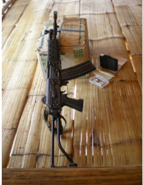
ကိုမ---, အကျိၣ်လၢအခးသံအသုးခိၣ်လွၢ်ကိၣ်အူ, ၁၀၇ (၃၄၁) လၢ အမုာ် န့ၣ်မ့အိၣ် အပုၤမၤစၢၤ အီၤ ခိၣ် ခံ ဂါ တ ဂါ န့ၣ်လီၤ. ကိုမ---, ဟံးန့ၢ်ကျိၣ်ဖဲအယုဖျီးအခါန့ၣ်လီၤ. (တၢ်ဂီၤကညီၣ်ဂါဒီ န့ၢ်ယံၣ်ကမ့ၢ်)

နအဖ သုးအခိၣ်ချ့သုးရၣ် ၁၀၇ (၃၄၁) အခိၣ်အမံၤမုာ်ဝဲ အိၣ်သီထီၣ် ဒီး အသုးရၣ်ခိၣ် (ခံ) အမံၤမုာ်ဝဲ မ့အိၣ်န့ၣ်လီၤ. အသုးခိၣ်ယီၤတခါအမံၤမုာ်ဝဲ လဲၣ်အူန့ၣ်လီၤ. အသုးဒု (တၢ) ခိၣ်မံၤမုာ်ဝဲ သုမ့ၣ်ထီၣ်, သုးဒု (ခံ) ခိၣ်မုာ် ဝဲ သုဝုထီၣ်, သုးဒု (သၢ) အခိၣ်မံၤမုာ်ဝဲ ထီၣ်န့ၣ်လီၤ. သုးဒု (လွံာ်) တခါ အိၣ်ဝဲဒှ်လၢ သုးကျိၣ် (ခံ) အဖီလၢဒီးသုးကျိၣ် (ခံ) အံၤဘၣ်တၢ်တိခိၣ် ရိၣ်မဲအီၤလၢ သုးရၣ်ခိၣ် (ခံ) န့ၣ်မ့အိၣ်န့ၣ်လီၤ. သုးရၣ်တဘျီအံၤအသုး ဒုအိၣ်ဝဲဒှ် (လွံာ်) ဒုဒီးအသုးဝဲလီၤခိၣ်သုၣ်န့ၣ်လီၤ. အသုးဝဲလီၤခိၣ်သု သုးရၣ်ခိၣ်မုာ်ပုၤလၢပၤဆုၢ်တၢ်န့ၣ်လီၤ. သုးရၣ်ခိၣ်အံၤအိၣ်ဝဲဒှ်ဒီးပုၤလၢ အမၤစၢၤအီၤတဂါန့ၣ်လီၤ. မ့မုာ် န့ၣ်မ့အိၣ် တခါပုၤလၢအမၤစၢၤအီၤမုာ်ဝဲ ဒှ်အိၣ်လွၢ်အူ အလီၤအလၢအပတီၢ်တခါမုာ်ဝဲဆၢခံၣ်ဖျၢၣ်န့ၣ်လီၤ. ပုၤဘၣ် မုာ်ဒါအဂါစ့ၢ်ကိးအိၣ်ဒီးဆၢခံၣ်ဖျၢၣ်န့ၣ်လီၤ.