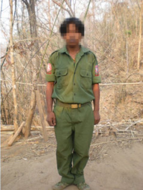
ကိုမ-----, (၂၃)န့ၣ် နအဖ သးယုၢ်ဖျိးပန်ဖျါထီၣ်ဝဲဒၣ်ဖဲ လါ အုၣ်ဖြၢၣ် ၂၀၀၈န့ၣ်န့ၣ်လီၤ။ ကိုမ -----, မၢ်ခိၣ်နီၢ်အိၣ်ဝဲဒၣ်လါခိၣ် နီၢ်အလီၢ်လါထီၣ်အစုၣ်စုၤအဖိလၢ ဒီးအဝဲခးသံၣ်ကံၤအသးခိၣ် ဒိဖျိမ့ၢ်အသးခိၣ်မၤတဖိတပါတၢ်တလီၢ်လီၤန့ၣ်လီၤ။ အဝဲယုၢ်ဖျိး အသးအုၣ်တၢ်လီၤလါကညီၣ်သးမ့ၢ်အကျိၣ်န့ၣ်လီၤ။ (တၢ်စီး ကညီၣ်တၢ် ဝိခွဲးယၢ်ကရူၢ်)

“ယယုၢ်ဖျိးလါ ခိၣ်ချ့သးရုၣ် ခလရ (၃၄၁) န့ၣ်လီၤ။ ယနီၢ်ကစီၣ်နီၢ်ဂံၢ်မ့ၢ်ဝဲ ဒၣ် -----, ယဖျိထီၣ်ထဲဒၣ်တတိၤန့ၣ်လီၤ။ ဖဲန့ၣ်အဆၢကတီၢ် (ဘၣ် ဖဲအဝဲဘၣ်တၢ်ထၢအုၣ်န့ၣ်အိၣ်အိၣ်လါကကဲသးဖိဖဲ လါဒိၣ်စဲဘၣ် ၂၀၀၂န့ၣ်), ယတံၣ်န့ၣ်မၤ တၢ်ဖဲဝဲတကူၣ်ဒီးပုၤဖိၣ်န့ၢ်ယၤဖဲယလဲၤဟးလိၣ်ကွဲးလါယဖါတၢ်အိၣ်အခါ န့ၣ်လီၤ။ ပါၤကီၢ်ခိၣ်မံၤမ့ၢ်ဝဲ ကျီၣ်ကွဲး စးယၤလါ “နလံၣ်အုၣ်သးတအိၣ် ဘၣ်အယိၣ်နကဘၣ်လဲၤအိၣ်လါယိၣ်ပုၤန့ၣ်လီၤ။ နမ့ၢ်တအိၣ်ဒီးလဲၤအိၣ်လါ ယိၣ်ပုၤဘၣ်န့ၣ်နကဘၣ်ကဲသးဖိန့ၣ်လီၤ”။ ဖဲန့ၣ်အခါ ယသးစးဒီးအဝဲ သ့ၣ်ကတိၤဘၣ်ယးတၢ်မနုၤလဲၣ်န့ၣ်ယတနၢ်ပၢ်ဂ့ၢ်ဂ့ၢ်ဘၣ်န့ၣ်လီၤ။ ဘၣ် ဆၣ်သနကွဲး ယတအိၣ်ဒီးလဲၤအိၣ်လါယိၣ်ပုၤဘၣ်အယိၣ်ယယုၣ်ထၢလါယ ကကဲသးန့ၣ်လီၤ။ အဆၢကတီၢ်ဖဲန့ၣ်ယသးန့ၣ်အိၣ်ဝဲ ၁၆ (မ့တမ့ၢ်) ၁၇န့ၣ် ဒီးယသးတအိၣ်နီတစဲးလါယကကဲသးဘၣ်န့ၣ်လီၤ။