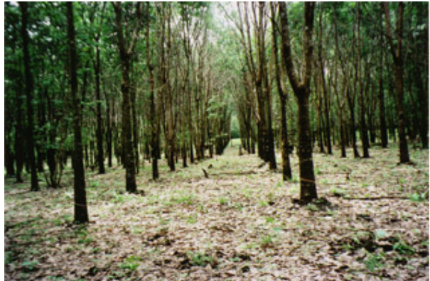
တၢ်အံၤမ့ၢ်ဝဲဒၣ် နအဖအရီၤဘၣ်ထူၣ်ဖဲတန့ၣ်ခါကီၢ်ဆၢၣ်န့ၣ်လီၤ. သဝီဖိသ့ၣ်တဖၣ်ထီၣ်န့ၣ်တၢ်မၤဆူၣ်မၤစိးအဝဲသ့ၣ်လၢကဘၣ်သ့ၣ်လီၤတၢ်, မၤပျီကွံာ်တပိုင်ဒီးကျိကွံာ်ဝဲဒၣ်သ့ၣ်ဒု ဝၣ်ဒုတဖၣ်ဒီးပုၤတဟ့ၣ်အဝဲသ့ၣ်တၢ်ဆီၣ်ထွဲမၤမၤကျိၣ်စ့နီတဘးဘၣ်န့ၣ်လီၤ. (တၢ်ဂီၤကညီၣ်ဂီၤစွဲးယၢ်ကဏ္ဍ)

နူဖီသဝီဖိလၢတန့ၣ်ခါကီၢ်ဆၢၣ်ဟီၣ်ကဝီၤပူၤ, ဖၣ်အၣ်ကီၢ်ရၢၣ် ဝးဝးအံၤဘၣ်တၢ်မၤဆူၣ်မၤစိးအဝဲသ့ၣ်လၢကဘၣ်မၤတၢ်လၢနအဖ ခကစၢ် အရီၤဘၣ်ကီၢ်ဒီး, ဒီးတၢ်လီၤတၢ်ကျဲတဖၣ်တခါန့ၣ်ဆူၣ်ဝဲလၢသဝီဖိလၢလီၤကဝီၤဖဲန့ၣ်တဖၣ်အတၢ်န့ၣ်လီၤ. တၢ်ဖံးတၢ်မၤတဖၣ်အံၤဟံးယုၣ်စ့ၢ်ကိးဒီးကဘၣ်မၤပျီကွံာ်တပိုင်လၢသ့ၣ်ထူၣ်ဝၣ်ထူၣ်ခိၣ်ထံး, ဘၣ်ကီၢ်ပျီဝဲဒၣ်သ့ၣ်ဒု ဝၣ်ဒု, ဘၣ်မၤပျီဝဲဒၣ်တၢ်လီၤလၢအသီလၢပုၤကသ့ၣ်တၢ်အဂီၢ်ဒီးဘၣ်သ့ၣ်လီၤဝဲဒၣ်သ့ၣ်ထူၣ်ပိလၢအသီတဖၣ်န့ၣ်လီၤ. တၢ်ဖံးတၢ်မၤသ့ၣ်တဖၣ်အံၤလၢသဝီဖိမၤခဲလၢာ်, တဟ့ၣ်ဝဲအပူၤကလံာ်နီတဘးဘၣ်, ရီၤဘၣ်လၢတၢ်ဆါအံၤဝံၤဒီးစ့အထိးနီၤန့ၣ်တဖၣ်န့ၣ်န့ၣ်လီၤက့ၤဝဲဒၣ်လၢသ့ၣ်မ့ၢ်လၢအပၤဝဲဒၣ်တၢ်သ့ၣ်တၢ်ဖျးတဖၣ်အထၢၣ်ပူၤန့ၣ်လီၤ.