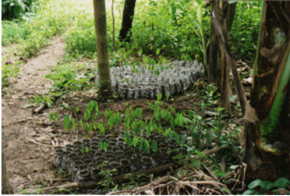
တံဆိပ်ကုန်း ကူးစူးပုဏ် အထူပိလီအမဲထိပ်ဘိဉ်ဘိဉ်တဖန်လၢကါကျဲကပၤဖဲတန့ၤ ကီၤဆၢကတံၤတံၤလၢအမ့ၢ် နအဖအတံၤမၤဆူၣ်သဝီဖိလၢကဘၣ်သ့ၣ်လီၤဝဲဒၣ်န့ၣ်လီၤ. (တံၤဂီၤ ကညီဂီၤဝီဒွဲးယၢ်ကဂ့ၢ်)

န့ၣ်လီၤ. ဝဲထီၣ်ကိးကိသဝီန့ၣ်သ့ၣ်ဖိတဖန်ဟံးန့ၣ်ဆူၣ်ဝဲသဝီဖိတဖန်အဆၢဖိကီၤဖိလၢအဘၣ်ထွဲဒီးသဝီဖိလၢအမံၤအိၣ်ကွဲးလီၤအသး န်လၢအံၤအသးန့ၣ်လီၤ.