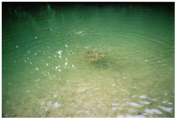
နီၣ်ဖိတဖျၢၣ်အံၤန့ၣ်, သဝီဖိလၢတန့ၤခါကီၤ ဆၢ တဖန် ဘၣ်ဝဲဒၣ် ညီၣ်လၢအကဲဝဲဒၣ် တံၤ ဟံးကီၤတခါလၢကထီၣ်ဒါ နအဖအတံၤ ဗုတံၤဖိတံၤသ့ၣ်အဂီၢ် န့ၣ်လီၤ. သဝီဖိတဖန် လၢ အ ဟ့ၣ်ဝဲဒၣ် တံၤဗုတံၤမ့ၢ်တန့ၢ်ဘၣ် တခီအဝဲသ့ၣ်ဟ့ၣ်ပူၤသးဖိလၢညီၣ်လၢအဘုၣ်သကိးဝဲ ဖဲနီၣ်ဖိတဖျၢၣ်အံၤအပူၤ, (မတမ့ၢ်) ဆါဝဲဒၣ်ညီၣ်လၢစ့ဝဲဒီး ဘုၣ်အါထီၣ်ကဒါက့ၤညီၣ် လၢနီၣ်ဖိတဖျၢၣ်အံၤအပူၤန့ၣ်လီၤ. (တံၤဂီၤ ကညီဂီၤဝီဒွဲးယၢ်ကဂ့ၢ်)

ဝဲလါအိးကထိဘၣ် ၂၀၀၆န့ၣ်, နအဖမူဒါခိၣ်တဖန်အိၣ် ဆီလီၤအသးဖဲမ့ၣ်ဝဲဒၣ်လၢအဘူးဒီးကီၣ်တဲၣ်ကီၢ်ဆၢ, ဟ့ၣ်လီၤတံၤ ကလုာ် လၢသဝီ ခိၣ် တဖန် လၢသဝီ တဖန် ဝဲ မဲၣ်ပျံၤဟီၣ်ကဝီၤလၢကဟဲထီၣ်တံၤအိၣ်ဖိၣ်ဝဲအဝဲသ့ၣ်ဟ့ၣ် လီၤတံၤကလုာ်လၢသဝီဖိတဖန်ကဘၣ်ပူၤဝဲဖဲထဲၣ်တံၤ (ညီ န့ၣ်တံၤသ့ၣ်လၢတံၤထံၣ်စံးဒီးတံၤဂၤ)လၢအပူၤမ့ၢ်ဝဲ တခိၣ် ၁၀၀.၀၀၀ ကွဲး န့ၣ်လီၤ. နအဖမူဒါခိၣ်တဖန်ဟံးဖျါထီၣ်ဝဲ ဒၣ်လၢဖဲလီၤလံၤဆူသဝီခိၣ် အအိၣ် လၢတံၤ အိၣ်ဖိၣ်ပူၤဒီး တဲသဝီခိၣ် တဖန် လၢခိပန့ၣ်လၢအဆီလီၤအသးဖဲ ဖၣ်အုၣ် ဝုၢ် န့ၣ်သ့ၣ်ဒီးဆါဝဲတန့ၢ်လၢဘၣ်အယီသဝီဖိကဘၣ်တံၤ မၤဆူၣ်မၤစိး လၢ ကဘၣ် ပူၤဝဲဒၣ် န့ၣ်လီၤ. ဝဲ အတံၤ ငှး န့ၣ် ထီၣ် ထွဲၤကထၢၣ် (ဖဲထဲၣ်တံၤ) ဝဲအလီၤခဲန့ၣ်တဲသဝီခိၣ် တဖန်လၢတံၤကဘၣ်ဟ့ၣ်စ့ၢ် စးထီၣ်လါမးဂုးတုၤလၢအုၣ်ဖျၢၣ် ၂၀၀၇န့ၣ် န့ၣ်လီၤ. နူဖိသဝီဖိလၢအလဲၤဘၣ်လၢတံၤအိၣ် ဖိၣ်အပူၤကျါတဂၤတဲဝဲဒၣ်လၢ “ပတသ့ၣ်ညါလၢပကဘၣ် သ့ၣ်ကါထွဲၣ်ကထၢၣ် (ဖဲထဲၣ်တံၤ) အံၤနဲ လဲၣ်ဝဲပပူၤဝဲ အလီၤခဲန့ၣ်လီၤ.”