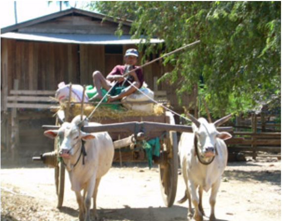
သဝီဖိတဂၤက့ၤစိာ်က့ၤအဘုဟုလၢအဝဲကူးဝံၤသုၣ်တဖၣ်ဆူအဘုဖိအအိၣ်န့ၣ်လီၤ. ဆၢကတီၢ်ခဲအံၤန့ၣ်အဝဲသုၣ်တဖၣ်တၢ်ဆၢကတီၢ်စ့ၢ်ဒိၣ်မးလၢကကူးဘုကူးဟုအဂီၢ်မ့ၢ်လၢအဝဲသုၣ်ဘဉ်မၤန့ၣ်တၢ်မၤဆူၣ်မၤဆိးတၢ်မၤ, ဟံၣ်သုၣ်စ့ၢ်ကိးဒီးတၢ်ကတၢ်ကတီၢ်ဟံၣ်စၢၤဒံၣ်ခုၣ်ဘဉ်အုၣ်နံနံထိပ်သီတၢ်အိၣ်မူးအိၣ်ပွဲသုၣ်တဖၣ်န့ၣ်လီၤ. (တၢ်ဂီၤ ကညီဂံၢ်ဝဲဒွဲးယၢ်ကရူၢ်)

တၢ်လီၤလၢတၢ်မၤလၢကပိၤနံနံထိပ်သီဒိၣ်ခိၣ်မ့ၢ်အကျါတတီၤလၢခိၣ်ဖျၢၣ်ဘီမၤဝဲန့ၣ်မ့ၢ်ဝဲဖဲအဝဲသုၣ်အိၣ်ဆိလီၤသးတၢ်လီၤဖဲကိကိာ်, လၢသဝီလၢအိၣ်လၢသုမ့ၢ်ကျိကၢ်နံၤဖဲကိၣ်တၢ်ကိဆၢန့ၣ်လီၤ. တနံနံအံၤ, ပယိးမုၢ်ဂဲၤဒိ, ခွါဂဲၤဒိအါဂၤဒီး ပယိးပုၤသးဝံၣ်တၢ်ဖိစဲၤနီၢ်အါဂၤလၢအအိၣ်လၢဝုၤတကူၣ်သုၣ်တဖၣ်ဘဉ်တၢ်ဟံၣ်စိာ်ဆိဆူတၢ်လီၤအံၤန့ၣ်လီၤ. အဝဲသုၣ်သုၣ်တဖၣ်ဘဉ်တၢ်စိာ်ဆိဆူဖျၢၣ်အုၣ်ကိာ်ဂျၢ်ဒီးပၤကိာ်သီလုၣ်ဒီးနအဖသုးပုၤခိးကးတၢ်ဖိသုၣ်တဖၣ်လဲၤယုၣ်တၢ်ဒီးအဝဲသုၣ်န့ၣ်လီၤ. ပုၤသဝီဖိသုၣ်တဖၣ်တဘဉ်ကညီဂံၢ်ဝဲဒွဲးယၢ်ကရူၢ်လၢသဝီလၢအအိၣ်ဘုးဒီးစ့ၢ်ကိာ်သုၣ်တဖၣ်, တဖျၢၣ်စ့ၢ်စ့ၢ်ဘဉ်ဟ့ၣ်ဝဲ ၅၀,၀၀၀ကွး လၢကမၤစၢၤတၢ်မၤလၢကပိၤနံနံထိပ်သီတဘျီအံၤအတၢ်လၢကတူၣ်လၢဂ်စ့ၢ်ဒီးပုၤအဂၤ ၁၀၀ ဂၤ လၢကမၤစၢၤတၢ်ဖဲတၢ်မၤအဂီၢ်အံၤဘဉ်တၢ်ယုၣ်လံၤအိၣ်လၢလါနီၣ်ဝဲဘဉ်လံၤလံၤလံၤန့ၣ်လီၤ. ခိဖျါလၢတၢ်အံၤအယိပုၤဘဉ်ကိဘဉ်ခဲလၢအအိၣ်လၢဒဲကဝီၤပုၤသုၣ်တဖၣ်ဟံၣ်ဆူတၢ်မၤမူးမၤပွဲတဘျီအံၤလၢကထံၣ်ဘဉ်ဒီးနၢဟုဘဉ်ပုၤသးဝံၣ်တၢ်ဖိစဲၤနီၢ်သုၣ်တဖၣ်အံၤန့ၣ်လီၤ. ဒ်န့ၣ်အသိး, ပုၤထံဂုၤကိာ်ဂၤအါမးစ့ၢ်ကိးဟံၣ်လဲၤလၢတၢ်မၤလၢကပိၤ