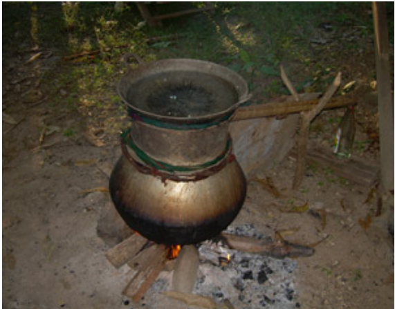
တၢ်ဒိဝဲသံးမၤ. ဖဲကညီနံနံထိပ်သီအဆိကတော်န့ၣ်ပုၤသဝီဖိသုၣ်တဖၣ်ဒိဝဲသံးမၤဒီးအိၣ်သကိးဝဲဖဲအဝဲသုၣ်မၤတၢ်လၢစုးစံၣ်ဝံၤအဆိကတော်န့ၣ်ဒီးအဝဲသုၣ်ဟ့ၣ်နီၤလီၤစ့ၢ်ကိးအသကိးဖိလၢအမၤစၢၤကူးစၢၤအဝဲသုၣ်ဘုဟုသုၣ်တဖၣ်စ့ၢ်ကိးန့ၣ်လီၤ.

“နံနံထိပ်သီအံၤမ့ၢ်ဝဲလၢပုၤကညီဖိခဲလၢကအဂီၢ်, ဘဉ်ဆဉ်တၢ်ကတၢ်ကတီၤဆိယၢ်စၢၤတၢ်ခါအံၤဒုးအိၣ်ထီၣ်တၢ်ကိတၢ်ခဲလၢပဂီၢ်နီၣ်မးန့ၣ်လီၤ. အဝဲသုၣ်မ့ၢ်ကတၢ်ကတီၤဆိယၢ်စၢၤတၢ်ထဲတန့ၣ်ကကိညၢ်ဒံးလၢပဂီၢ်ဒံး. ပုၤသးစၢ်သုၣ်တဖၣ်တအိၣ်ဒီးလဲၤဘဉ်ခီဖျါလၢ, ဖဲပလဲၤမၤစၢၤန့ၣ်အတၢ်အခါပစုတအိၣ်လၢပကမၤအိၣ်တၢ်အဂီၢ်ဘဉ်န့ၣ်လီၤ. ဆၢကတီၢ်ခဲအံၤန့ၣ်သဝီဖိသုၣ်တဖၣ်ဘဉ်မၤတၢ်လၢစံၣ်ပုၤဖဲမ့ၢ်ဆါဆိဆၢကတီၢ်ဒီးဘဉ်အိၣ်ဘုးဝဲဖဲမ့ၢ်န့ၣ်ဆၢကတီၢ်ဒီးသိးအဝဲသုၣ်ကမၤဝံၤက့ၤအဘုအဟုချူအဂီၢ်န့ၣ်လီၤ.”